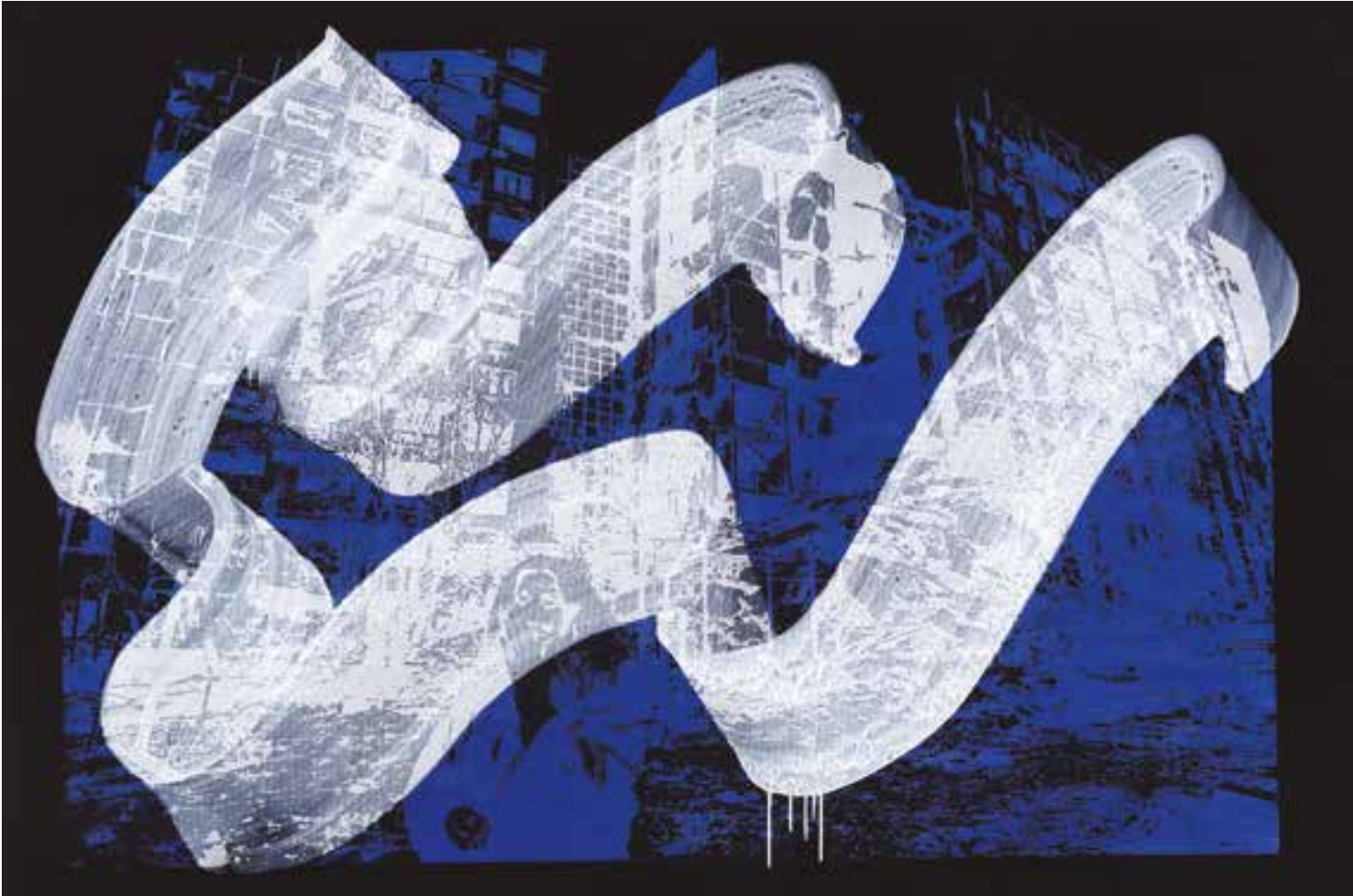
W&W (War and Women) Acrylique et encre sérigraphique sur toile 100 x 150 cm 2023