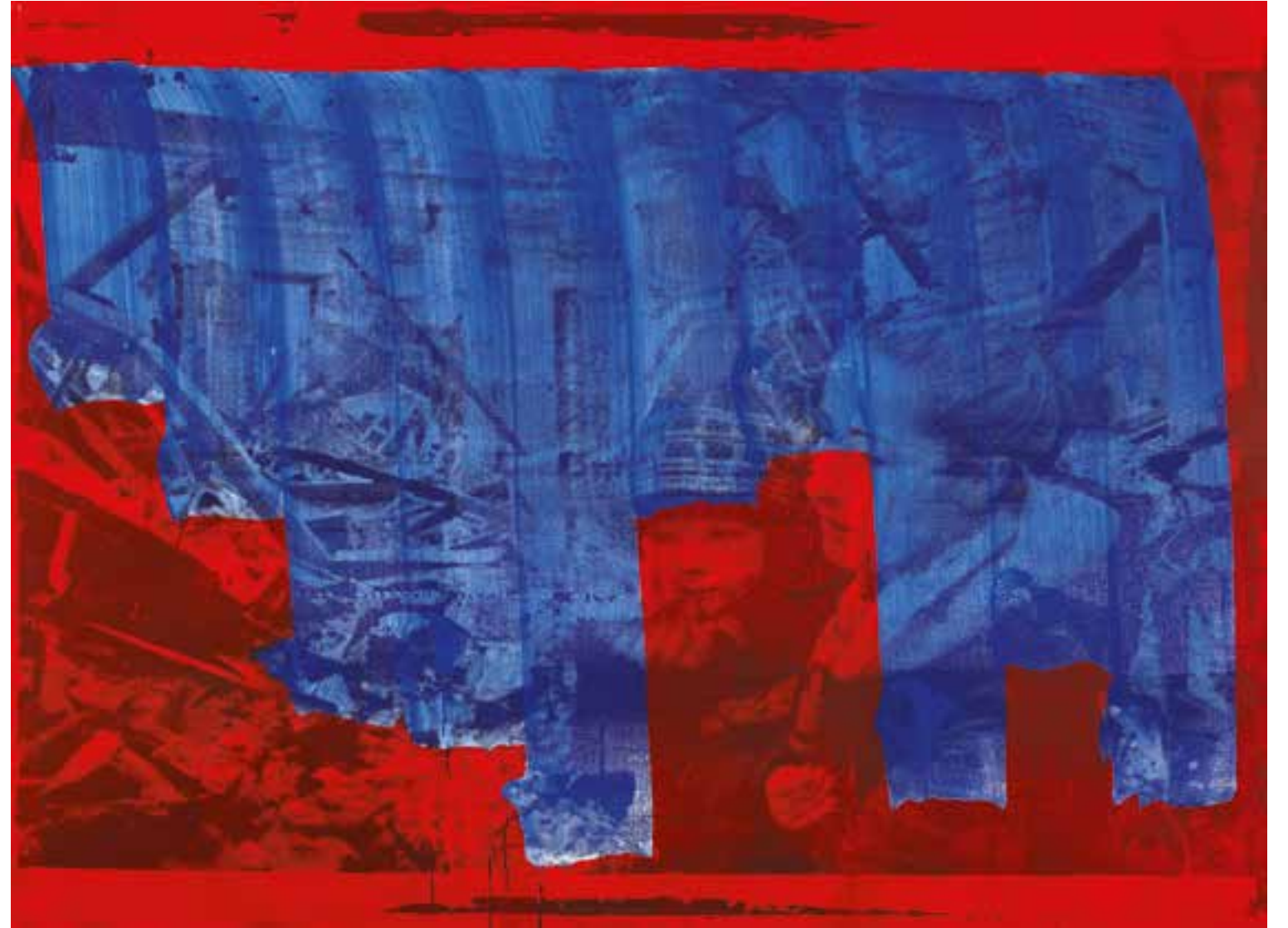
W&W (War and Women) Acrylique et encre sérigraphique sur toile 150 x 200 cm 2023