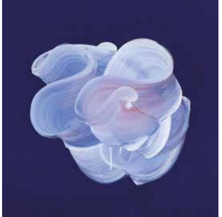
Rosebud Technique mixte sur toile 65 x 65 cm (chaque) 2024