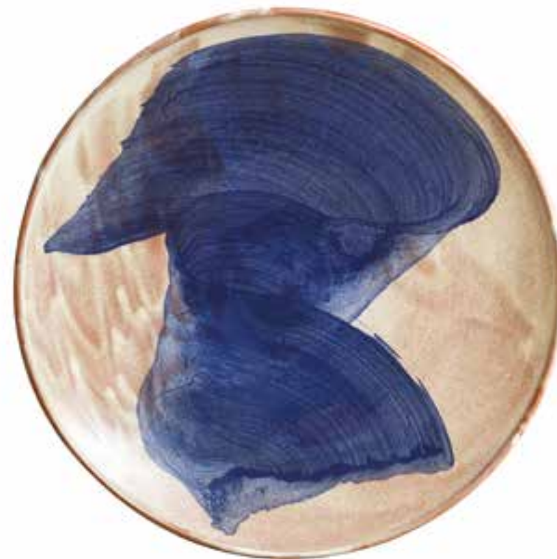
Série touche, #1 & #2 Céramique en argile rouge ø 40 cm (chaque) 2019