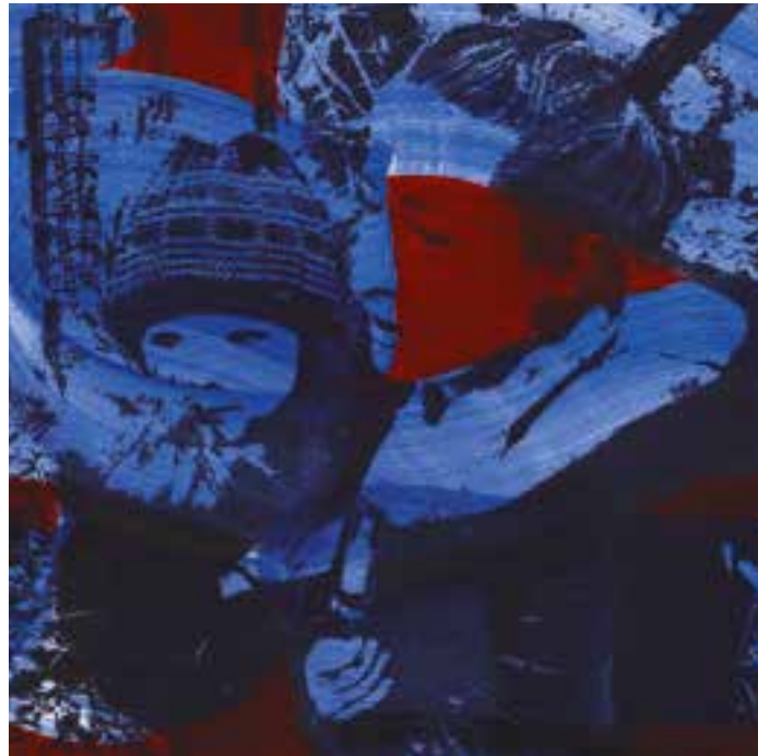
W&W (War and Women) , détail