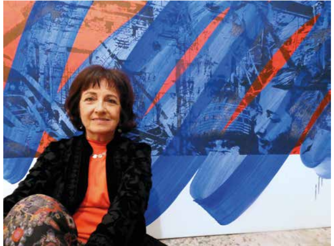
Dans l'atelier de l'artiste à Ivry-sur-Seine, mars 2024

Musée National d'art moderne du Centre Georges Pompidou, France Musée d'art moderne de Céret, France Musée national des Beaux-Arts, Jordanie Musée des Beaux-Arts de Montbéliard, France Musée des Beaux-Arts de Caen, France Musée du Château des ducs de Wurtemberg, France Musée Mohammed VI d'art moderne et contemporain, Maroc Musée d'Art Contemporain Africain Al Maaden, Maroc Institut du monde arabe, France Fonds national d'art contemporain, France FRAC de Basse-Normandie, France Fondation Shoman, Jordanie Fondation TGCC, Maroc Fondation Camille, France Fondation Mercedes-Benz, France Fondation Colas, France Fondation ONA, Maroc Société Générale, Maroc Office Chérifien des Phosphates, Maroc Attijariwafa bank, Maroc Caisse de Dépôt et de Gestion, Maroc Compagnie Africaine d'Assurance, Maroc Collection IBM, France Collection de la Ville de Paris, France Collection de la Ville de Caen, France Collection de l'Assistance publique, France Bibliothèque Nationale, France