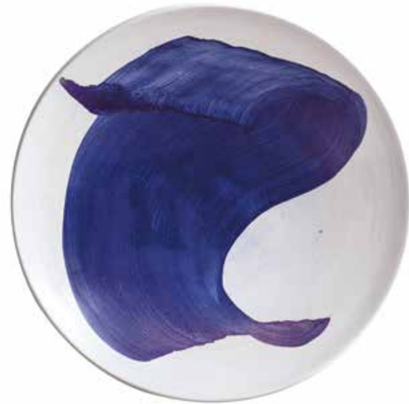
Série touche, #3 & #4 Céramique en argile rouge et blanche ø 40 cm (chaque) 2019 & 2020