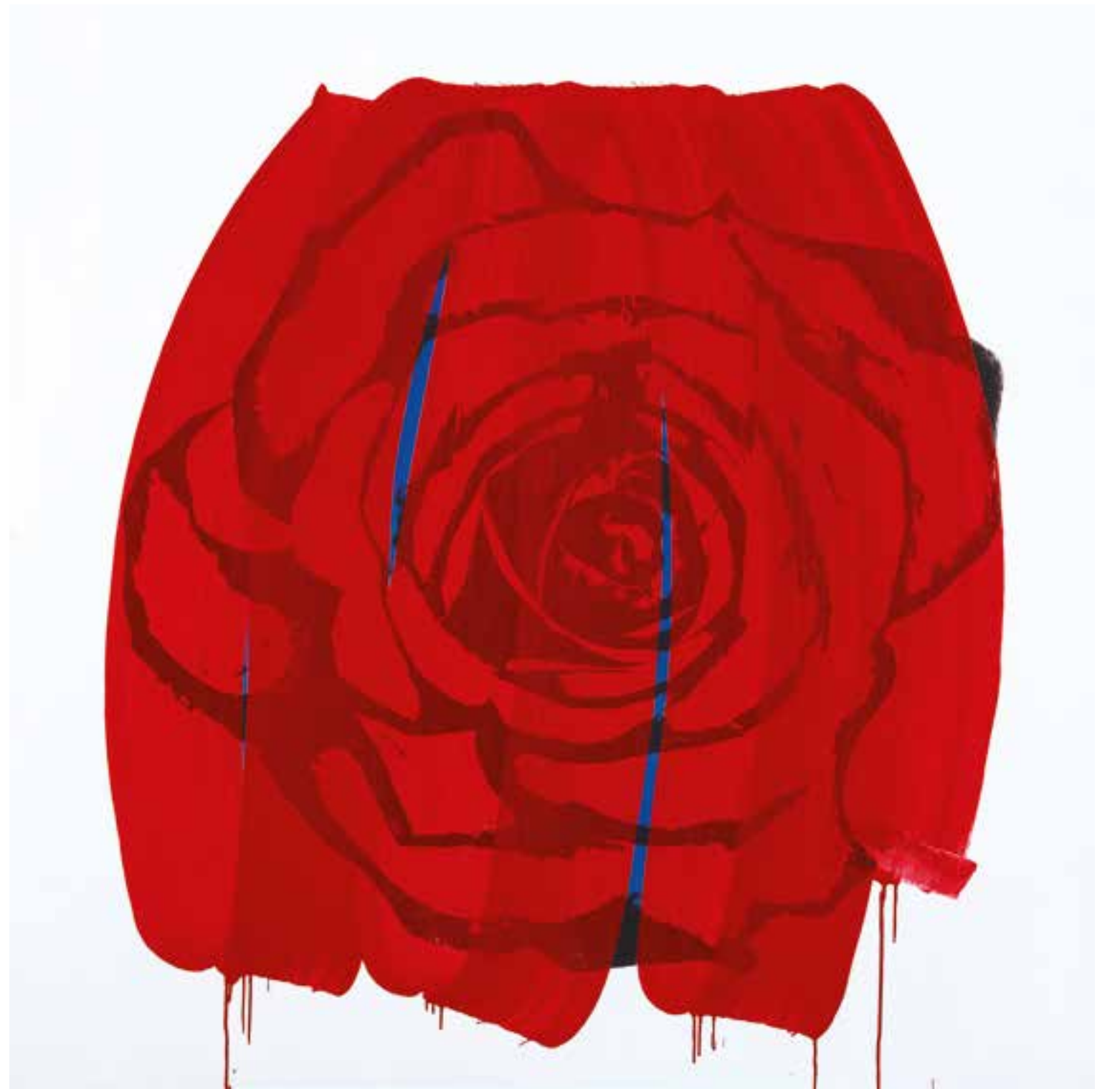
Rosebud Acrylique et encre sérigraphique sur toile 150 x 150 cm 2024