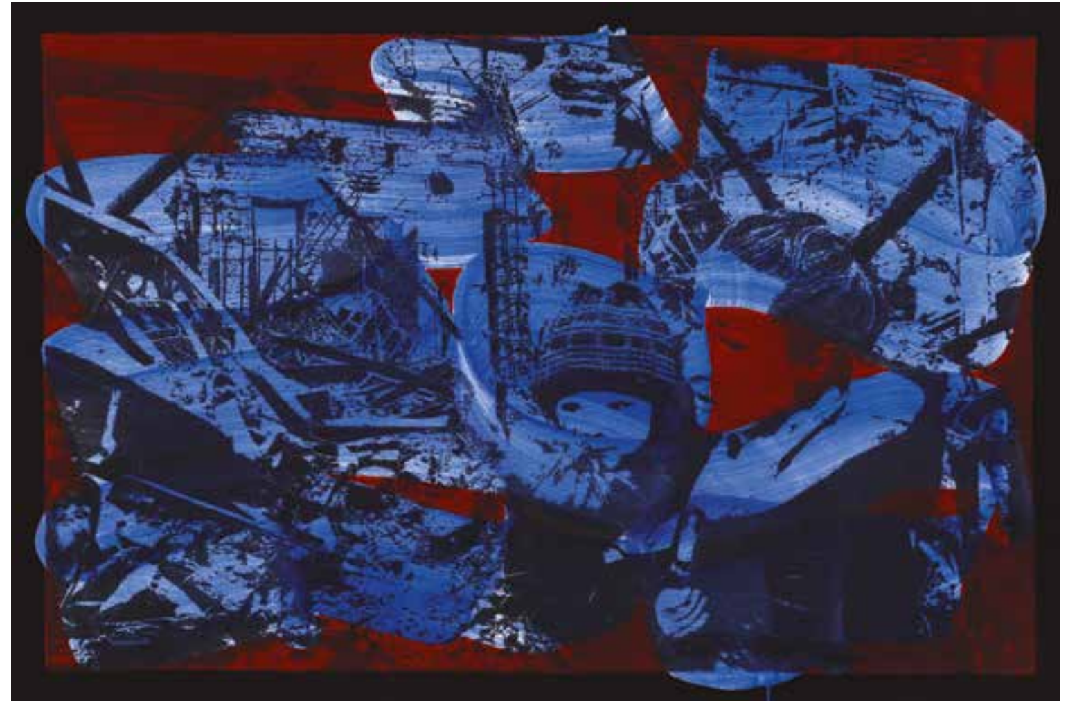
W&W (War and Women) Acrylique et encre sérigraphique sur toile 100 x 150 cm 2023