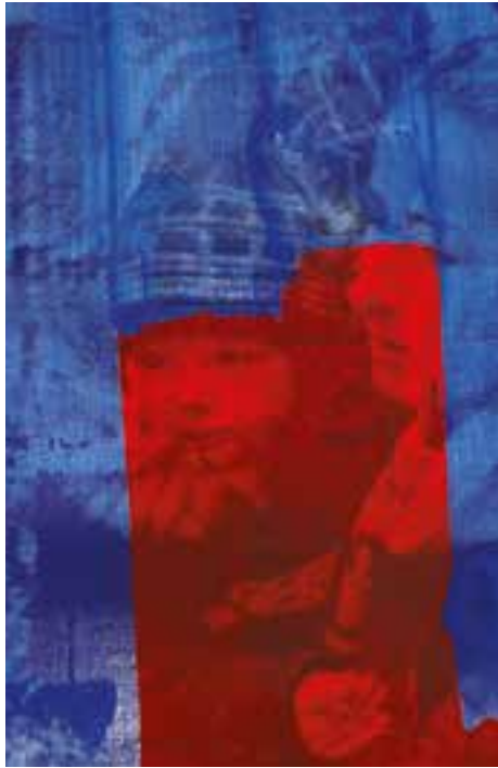
W&W (War and Women), détail