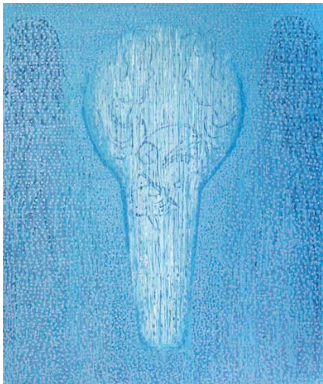
Sans titre , 2014 Acrylique sur toile 153 x 130 cm