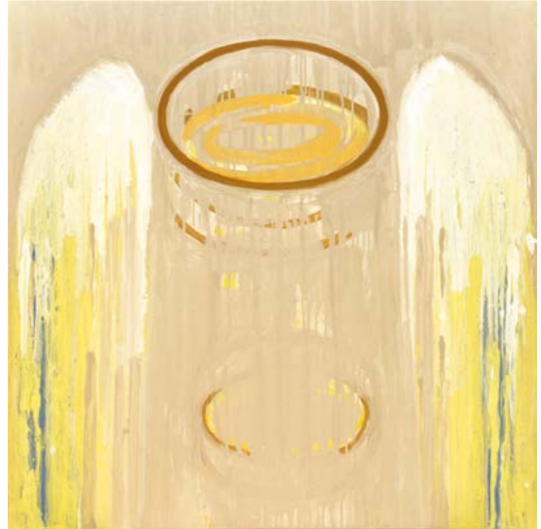
Sans titre Acrylique sur toile 100 x 100 cm