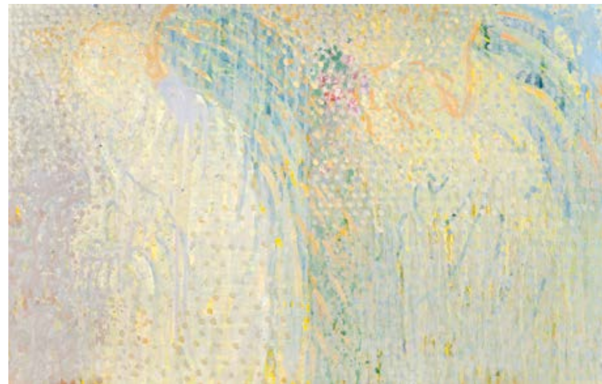
Sans titre , 2014 Acrylique sur toile 65 x 100 cm