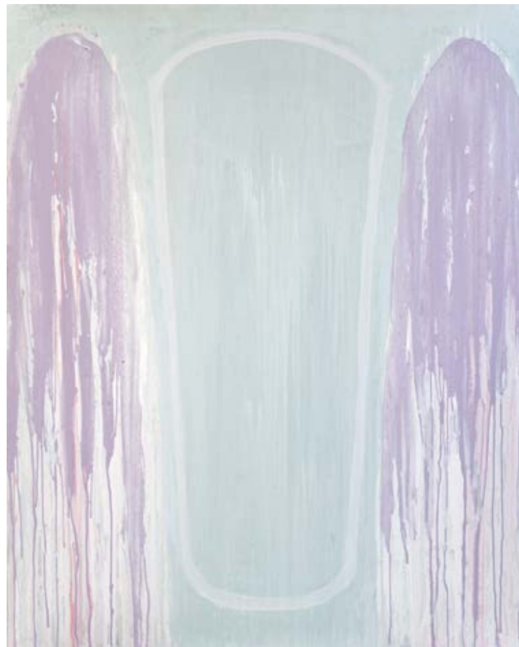
Sans titre , 2014 Acrylique sur toile 160 x 130 cm