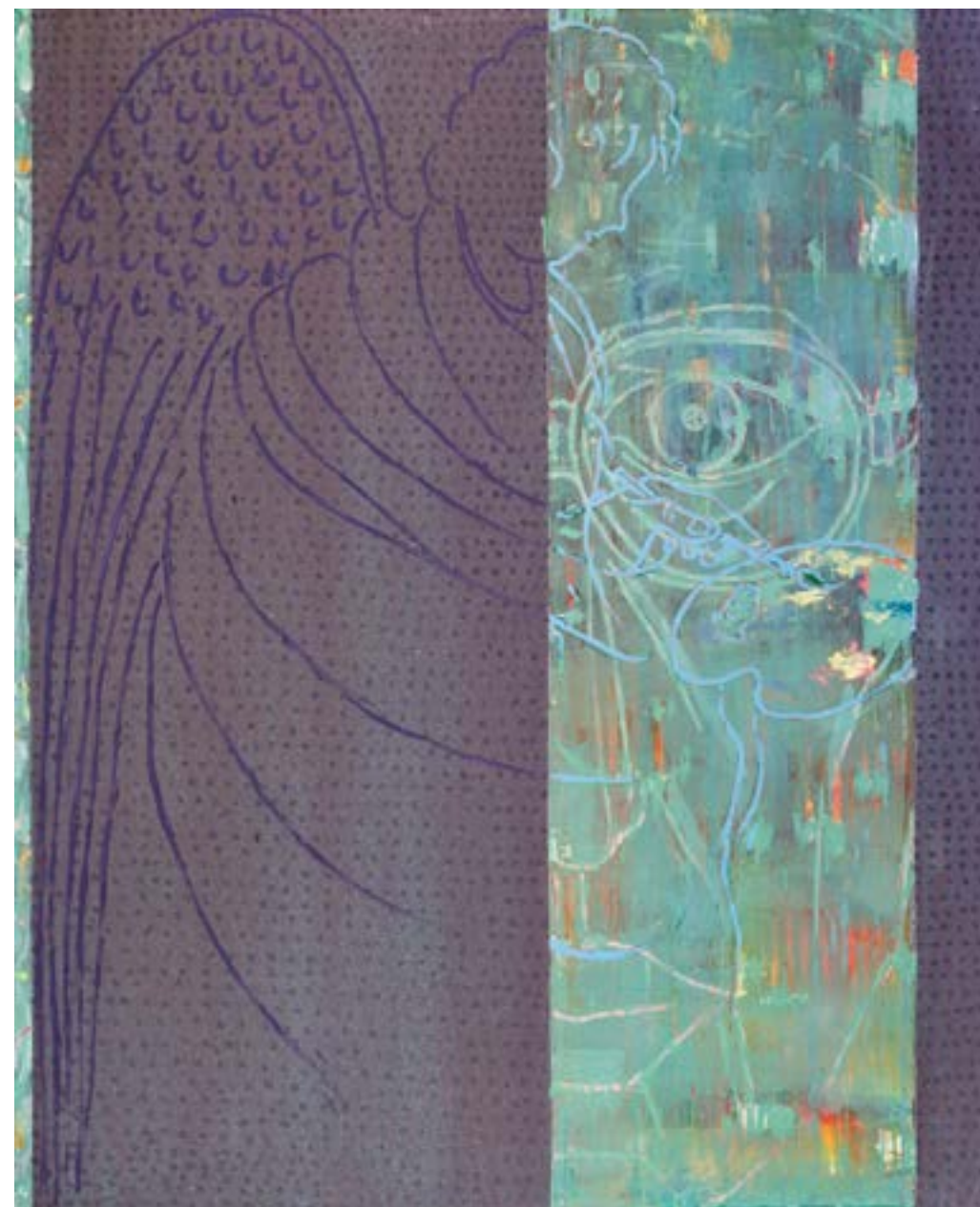
Sans titre , 2014 Acrylique sur toile 160 x 130 cm