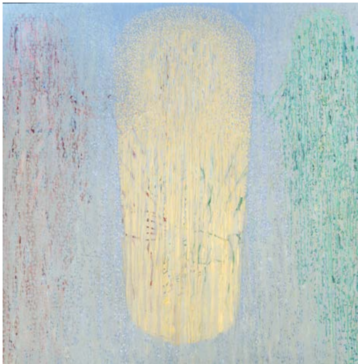
Sans titre , 2014 Acrylique sur toile 150 x 150 cm