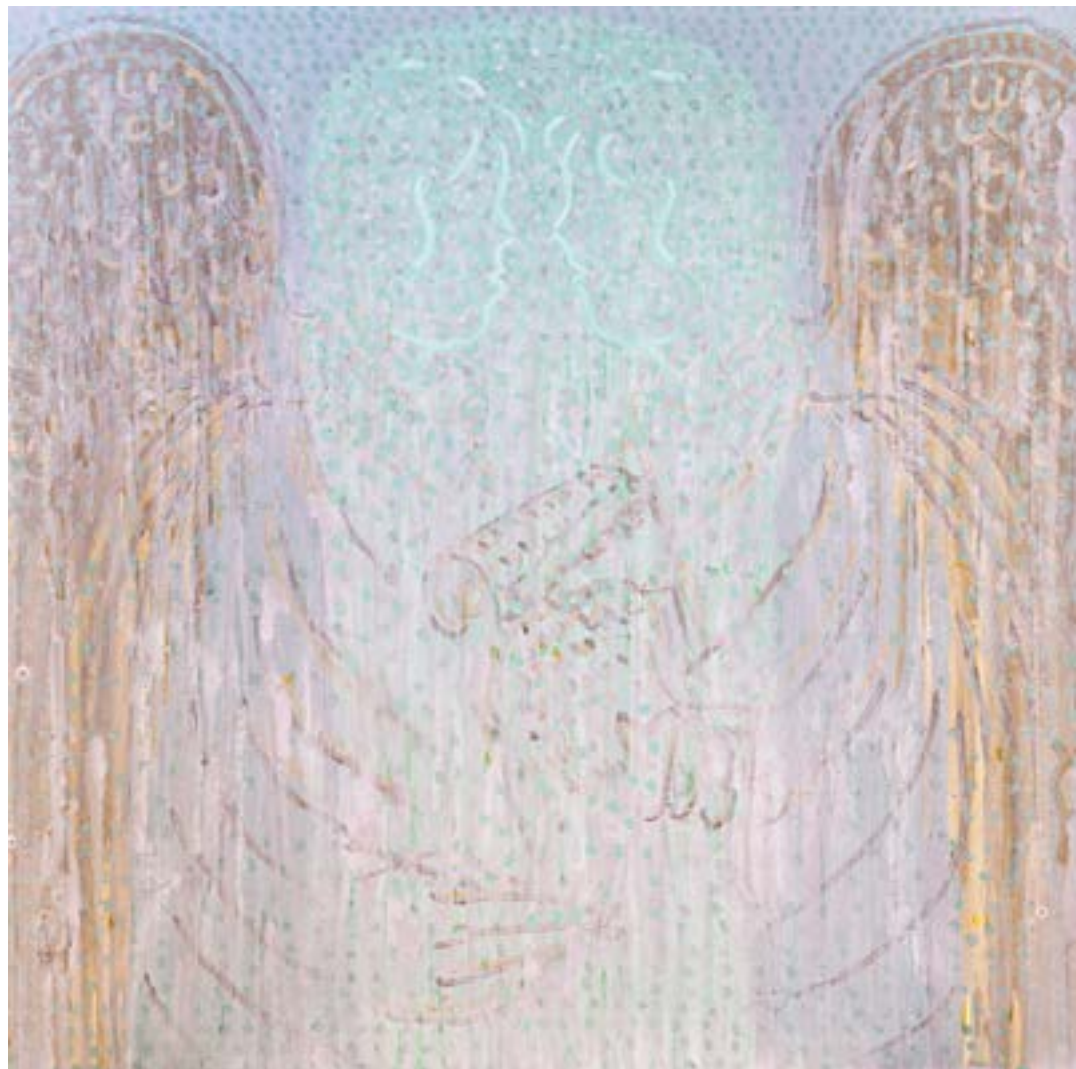
Sans titre , 2014 Acrylique sur toile 100 x 100 cm