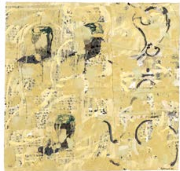
Sans titre , 2014 Acrylique sur papier 50 x 50 cm