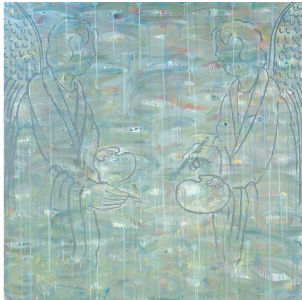
Sans titre , 2014 Acrylique sur toile 150 x 150 cm