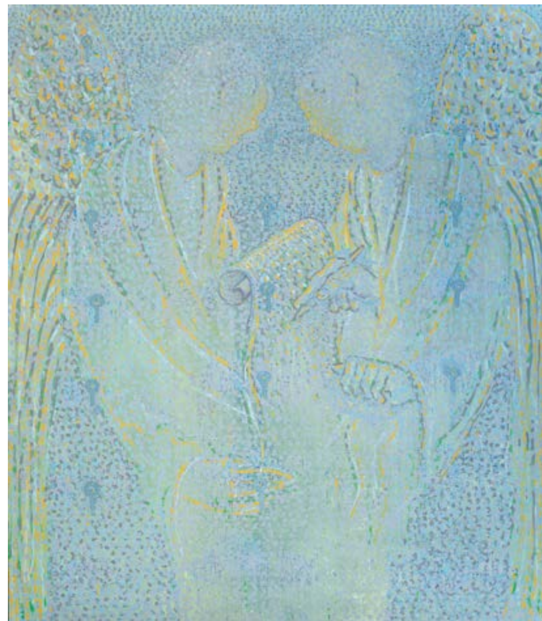
Sans titre , 2014 Acrylique sur toile 160 x 130 cm