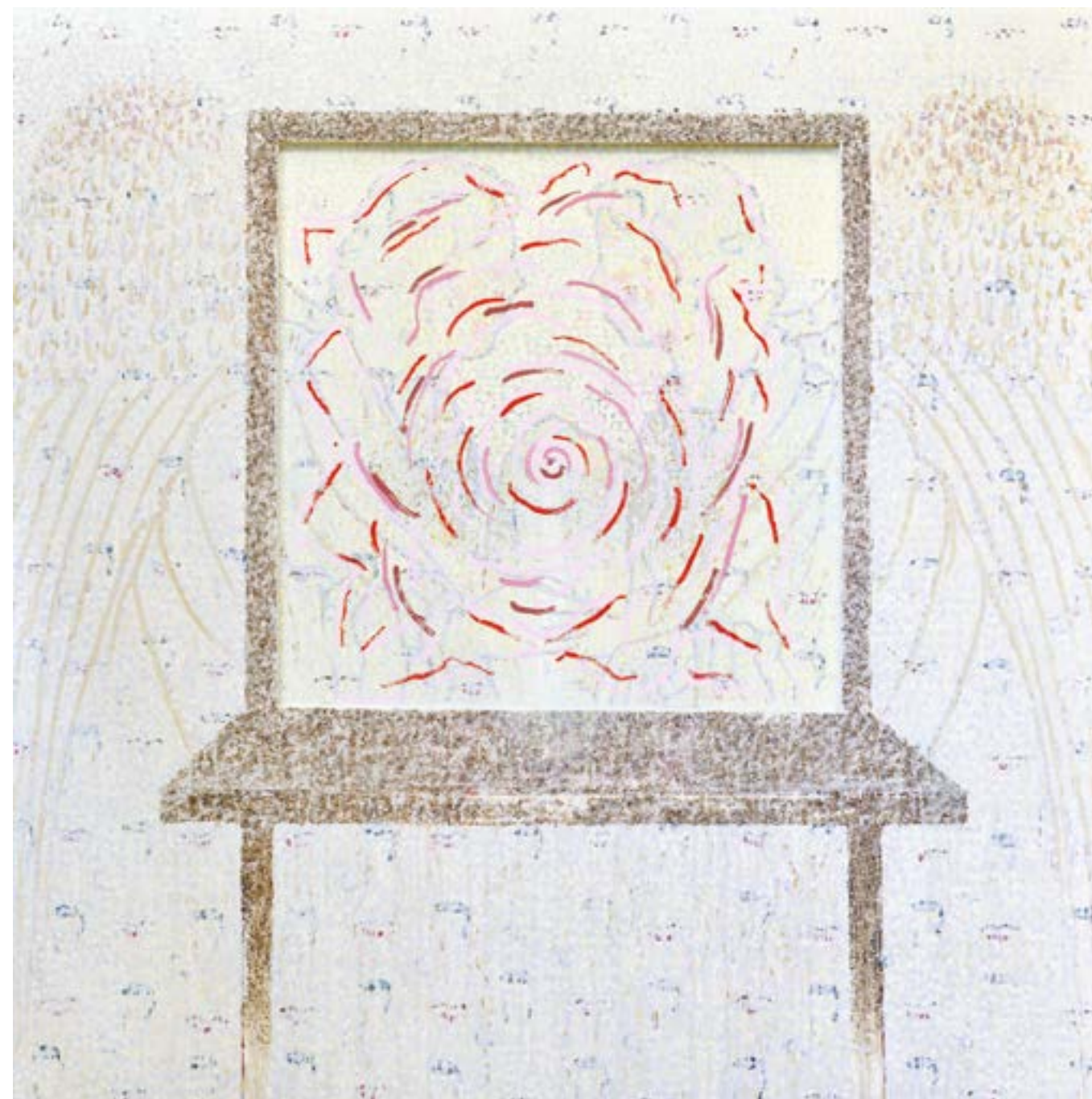
Une nuit et un jour 2 , 2008-2014 Acrylique et journal marouflé sur toile 200 x 200 cm