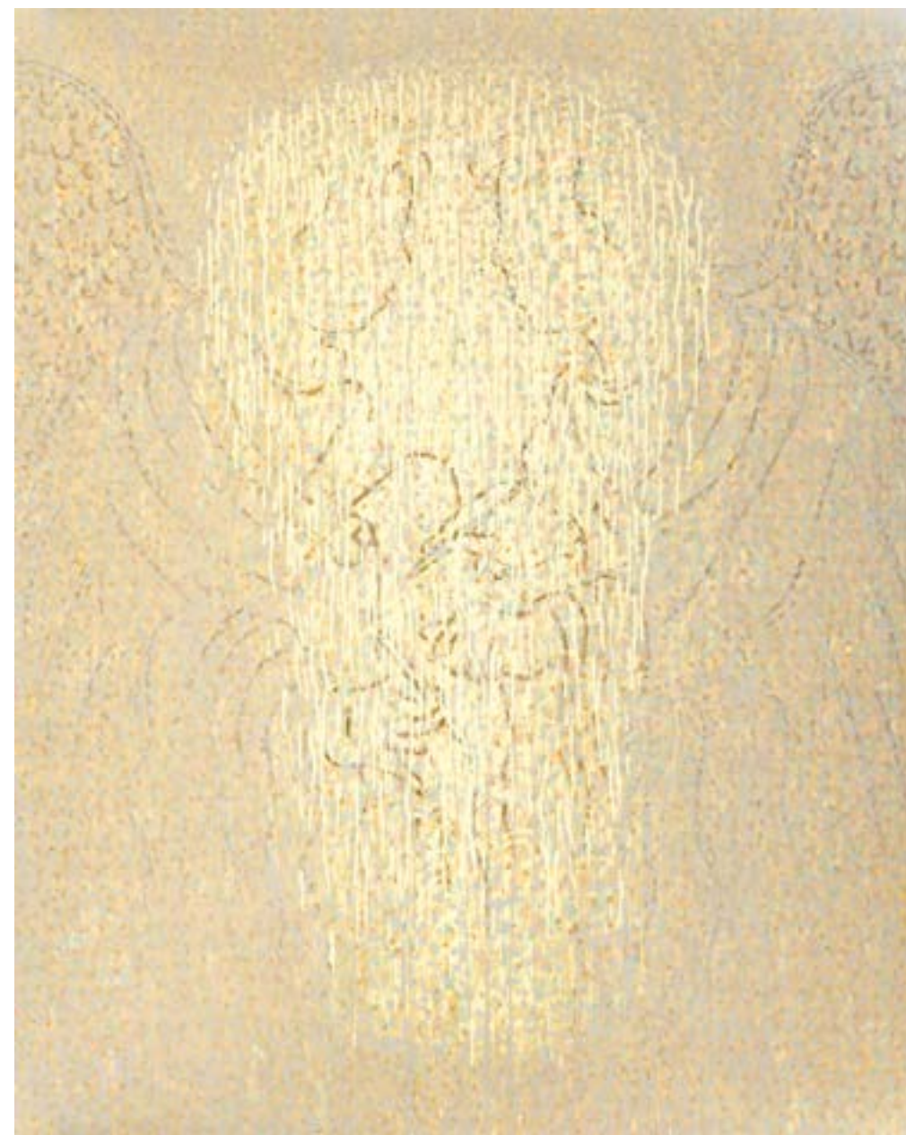
Sans titre , 2014 Acrylique sur toile 160 x 130 cm