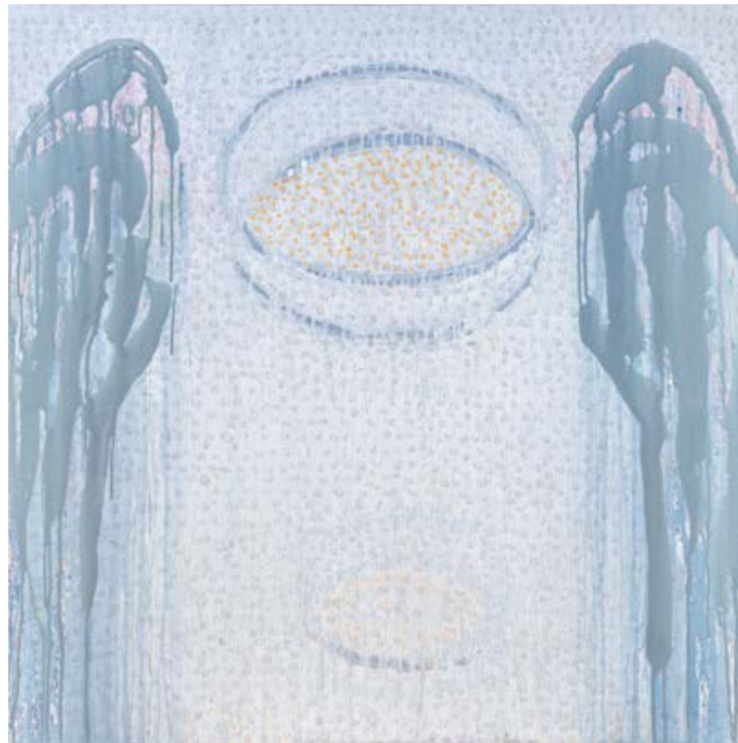
Sans titre , 2014 Acrylique sur toile 100 x 100 cm