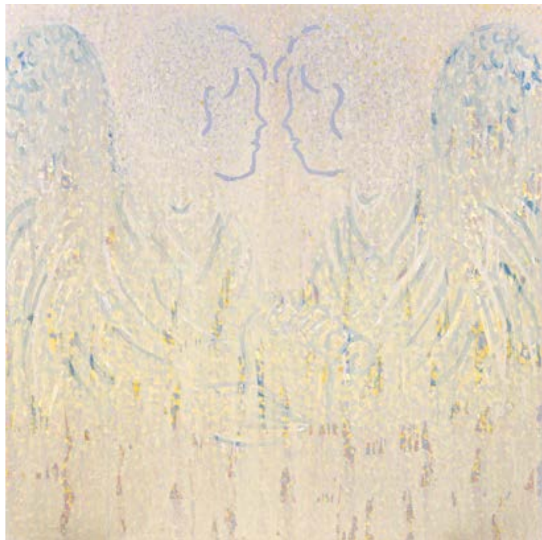
Sans titre , 2014 Acrylique sur toile 100 x 100 cm