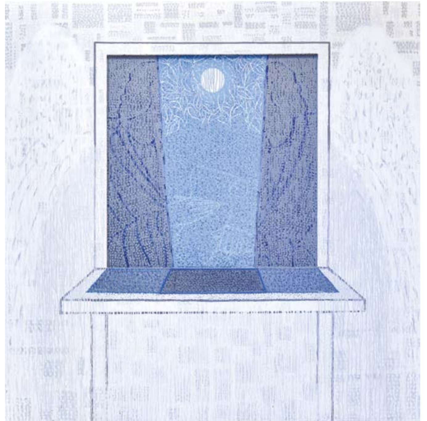
Une nuit et un jour 1 , 2008-2014 Acrylique et journal marouflé sur toile 200 x 200 cm