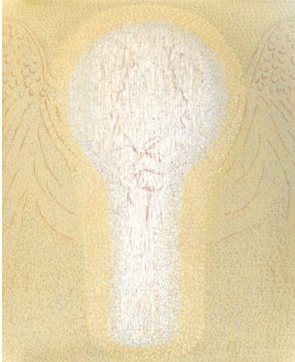
Sans titre , 2014 Acrylique sur toile 160 x 130 cm