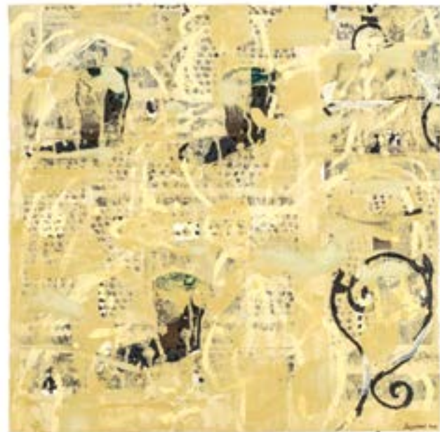
Sans titre , 2014 Acrylique sur papier 50 x 50 cm