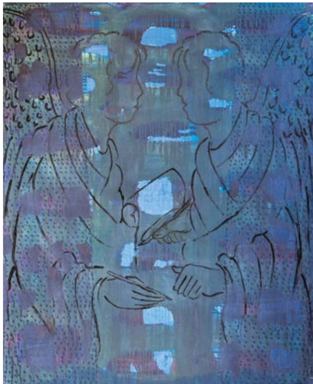
Sans titre , 2014 Acrylique sur toile 160 x 130 cm