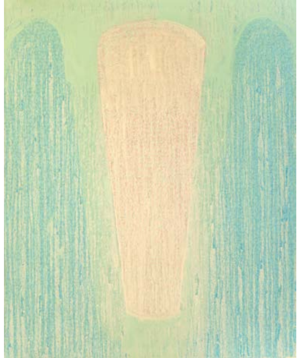
Sans titre , 2013 Acrylique sur toile 160 x 130 cm