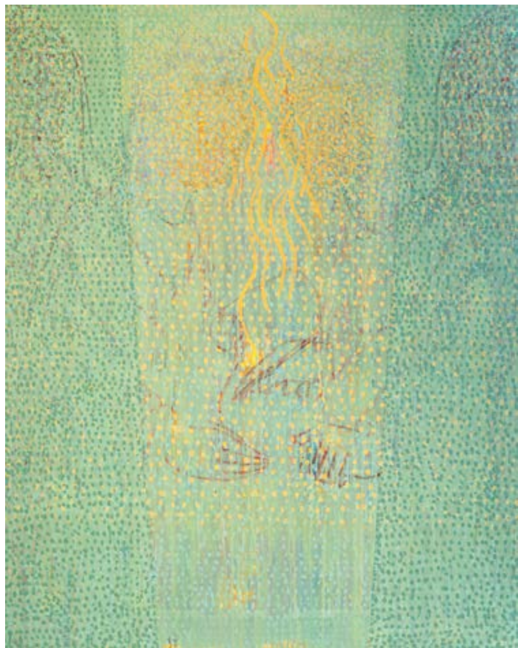
Sans titre , 2014 Acrylique sur toile 160 x 130 cm