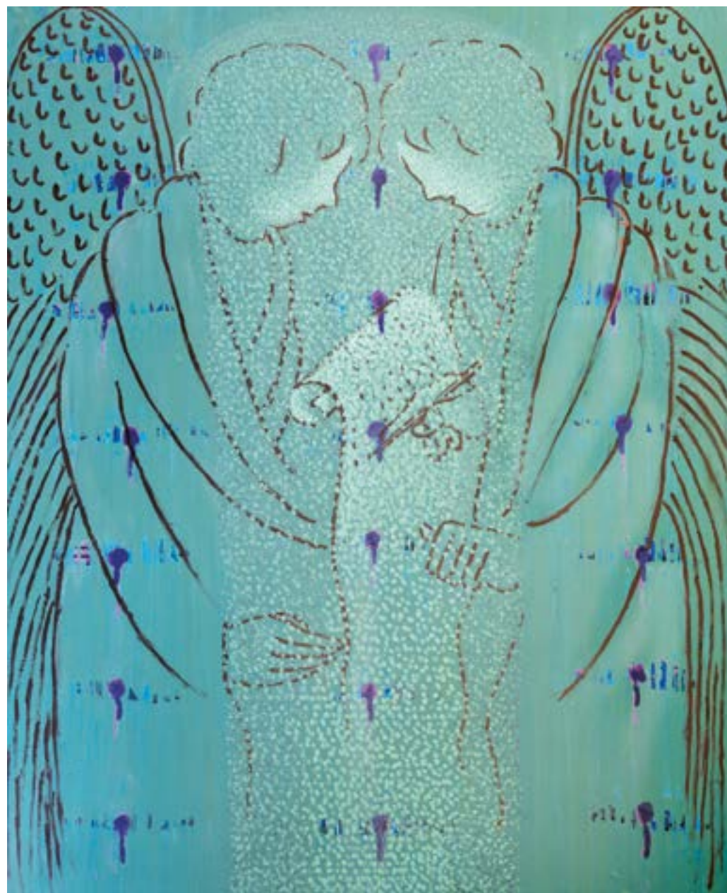
Sans titre , 2014 Acrylique sur toile 160 x 130 cm