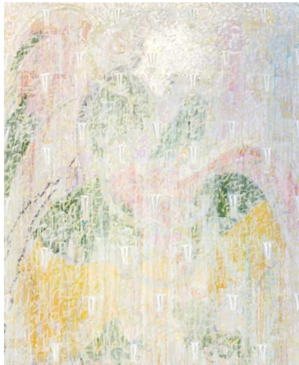
Sans titre , 2006-2014 Acrylique sur toile 160 x 130 cm