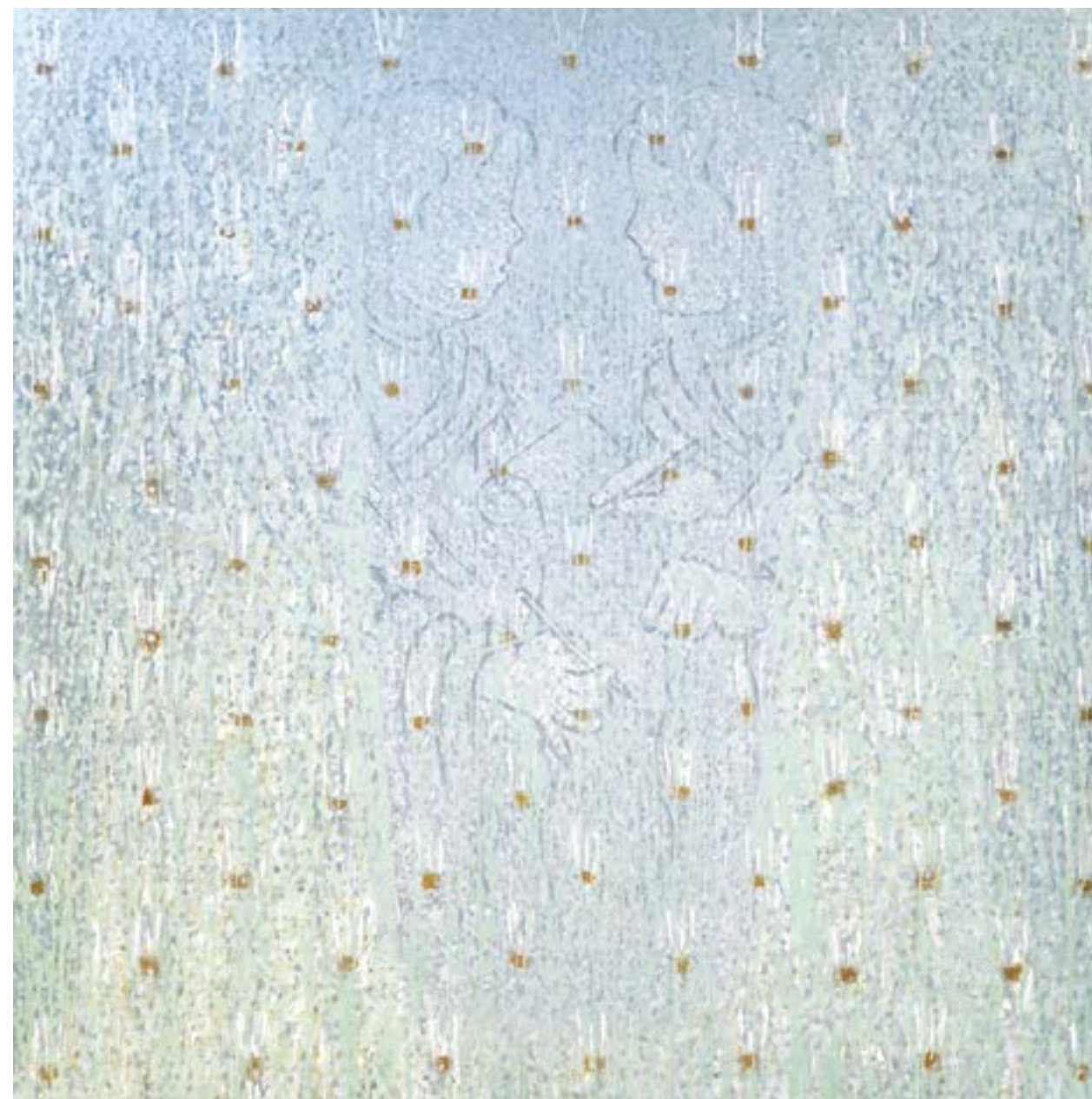
Sans titre , 2006-2014 Acrylique sur toile 150 x 150 cm