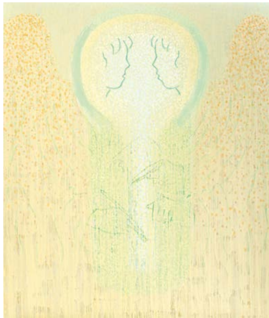
Sans titre , 2014 Acrylique sur toile 153 x 130 cm