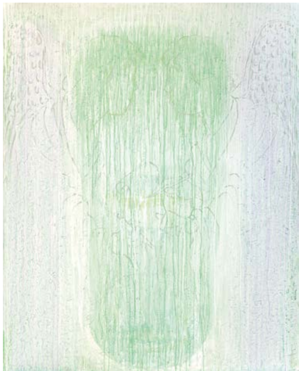
Sans titre , 2014 Acrylique sur toile 160 x 130 cm