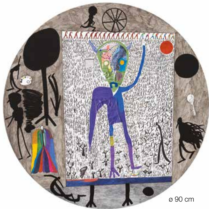
ø 90 cm