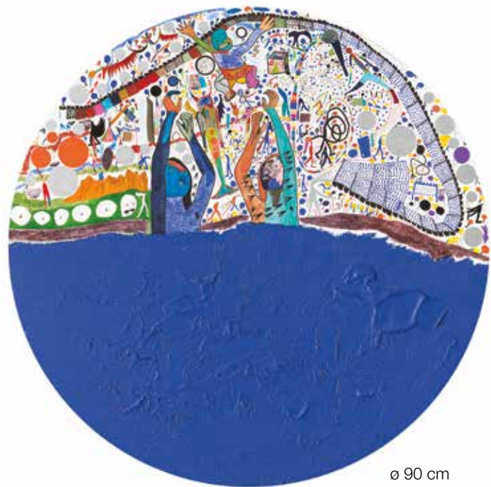
ø 90 cm