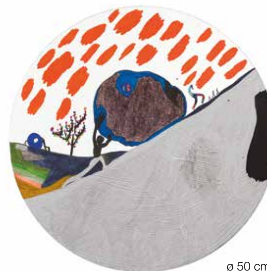
ø 50 cm

Brutal aesthetics, The child trying to be happy, Casa, The poem of the sun, Everyday is an old day & Jabal Al Hayat Technique mixte sur toile 2022