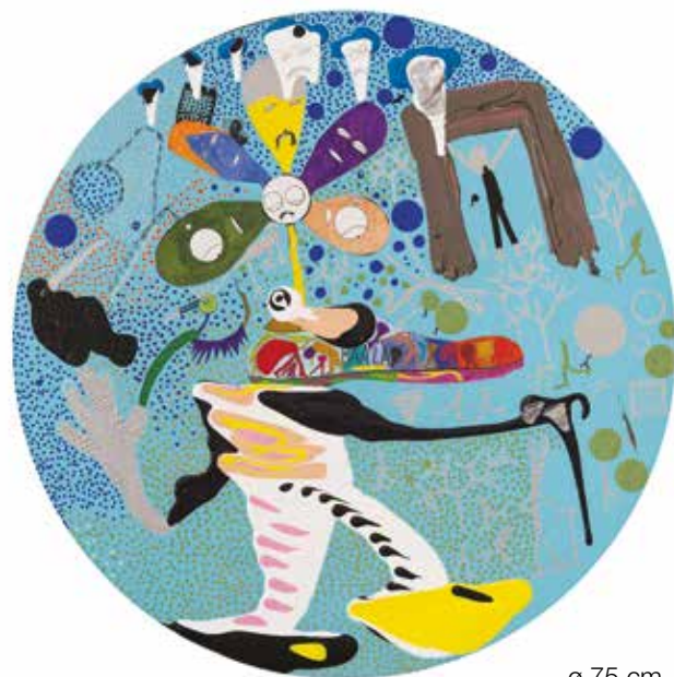
ø 75 cm