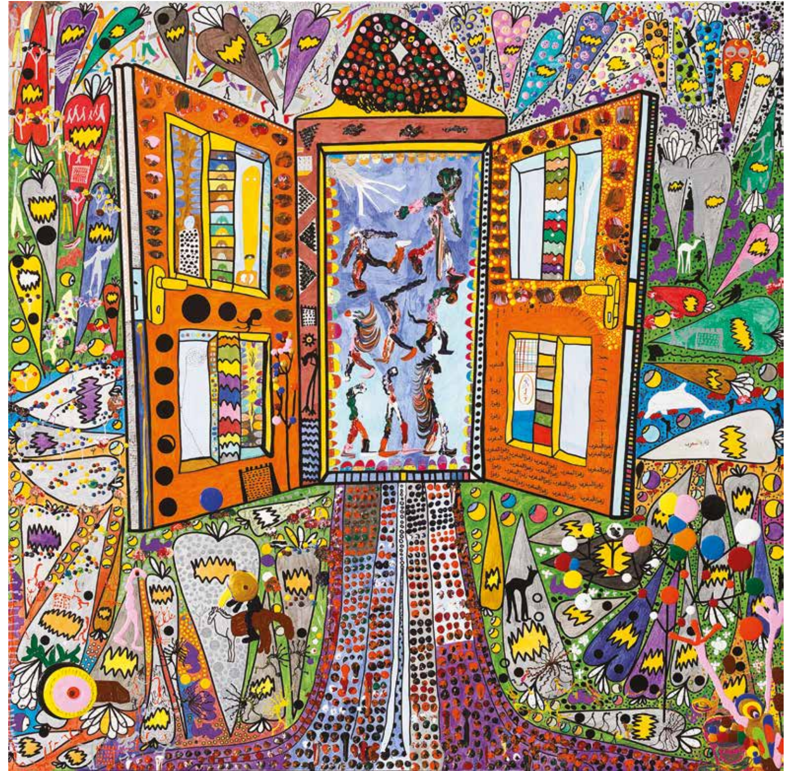
Women of light Technique mixte sur toile 150 x 150 cm 2022