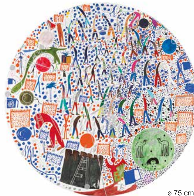
ø 75 cm