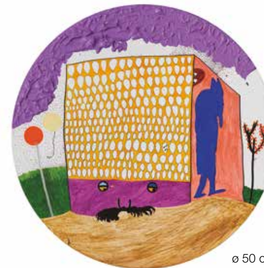
ø 50 cm