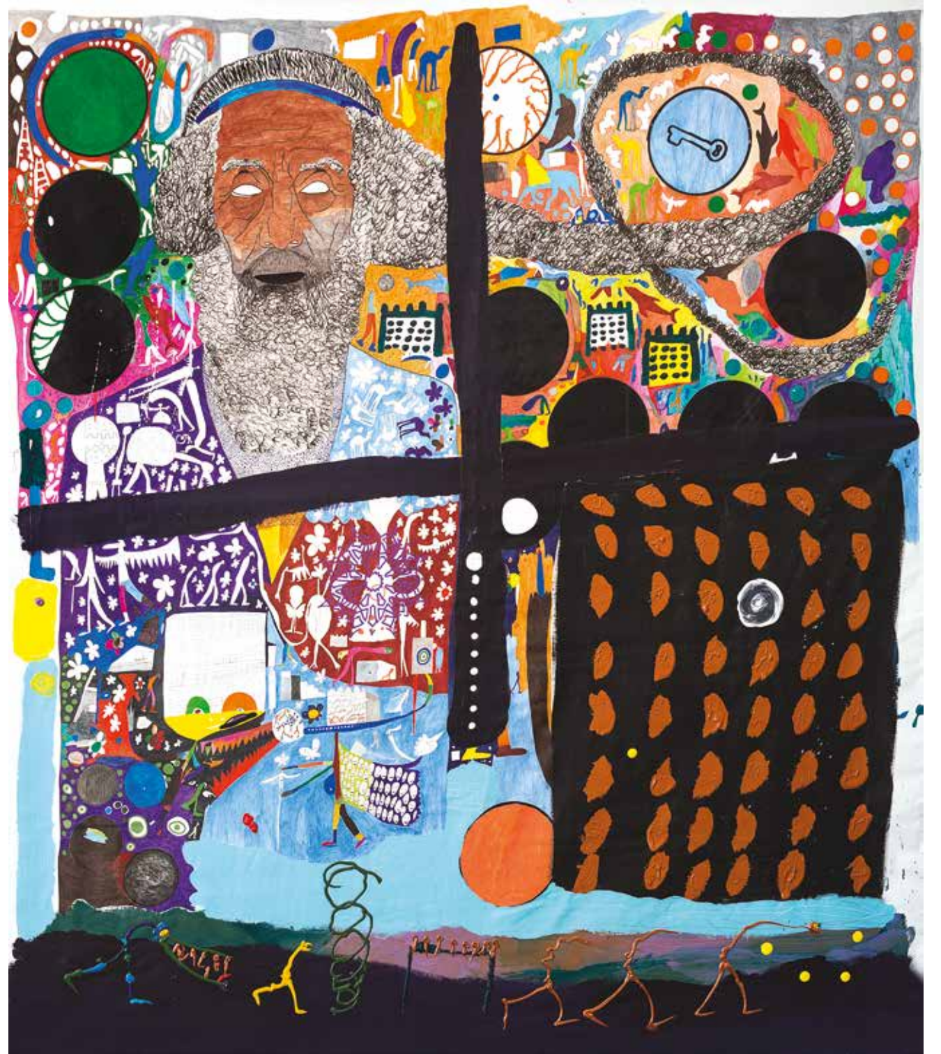
Homeros and the dance Technique mixte sur toile 200 x 197 cm 2022