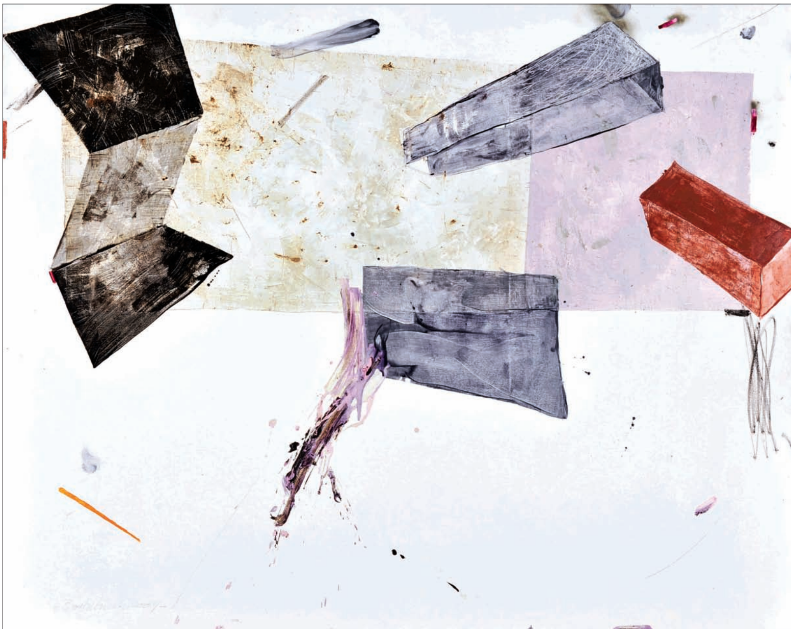
Sans titre Technique mixte sur toile 190 x 150 cm 2009