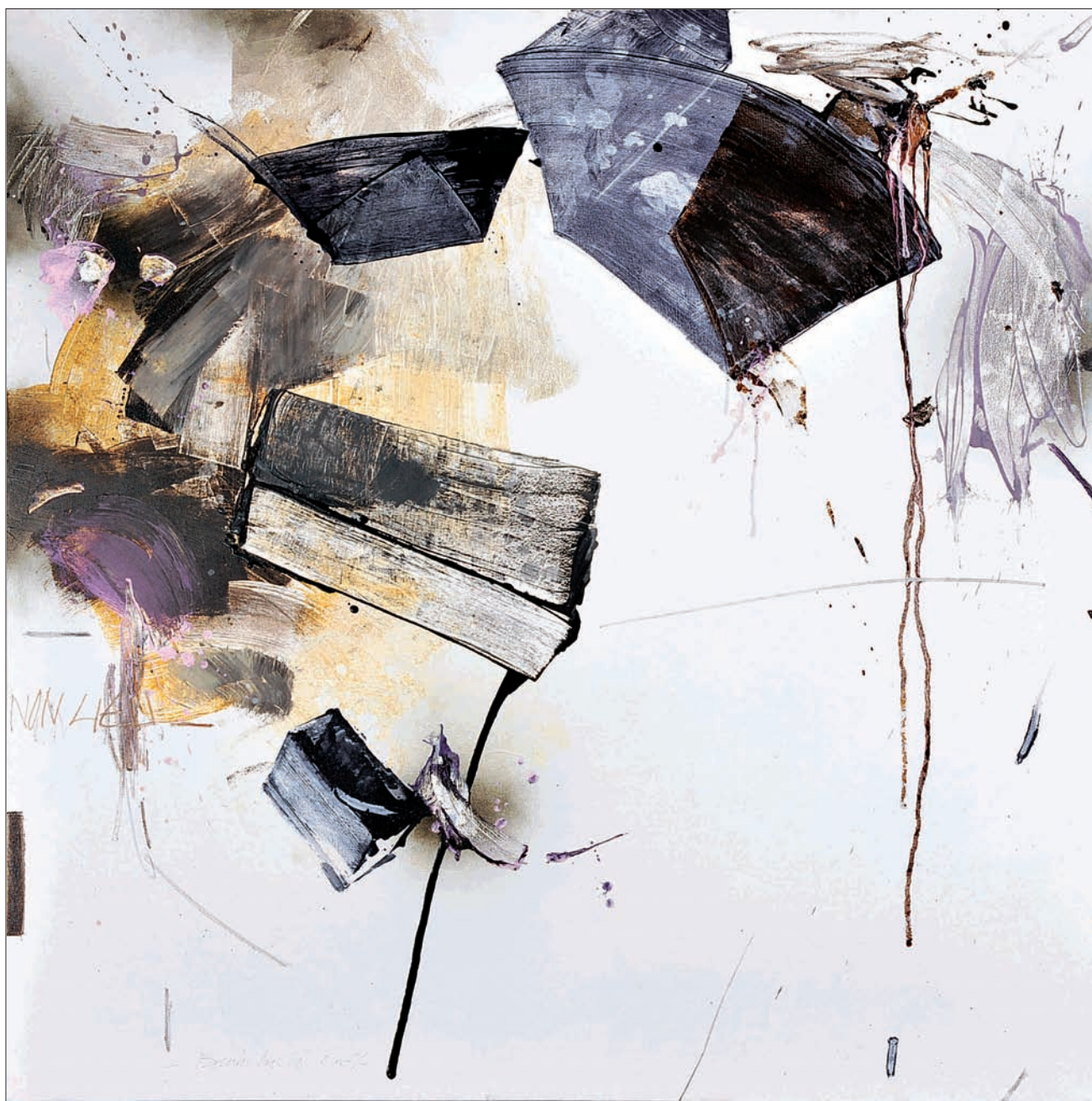
Sans titre Technique mixte sur toile 140 x 140 cm 2009