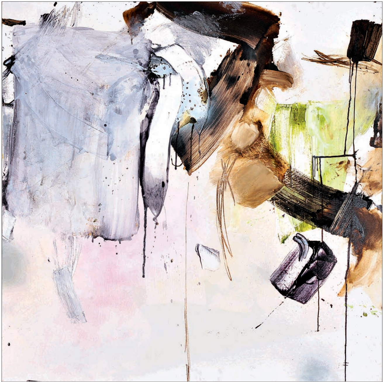
Sans titre Technique mixte sur toile 140 x 140 cm 2009