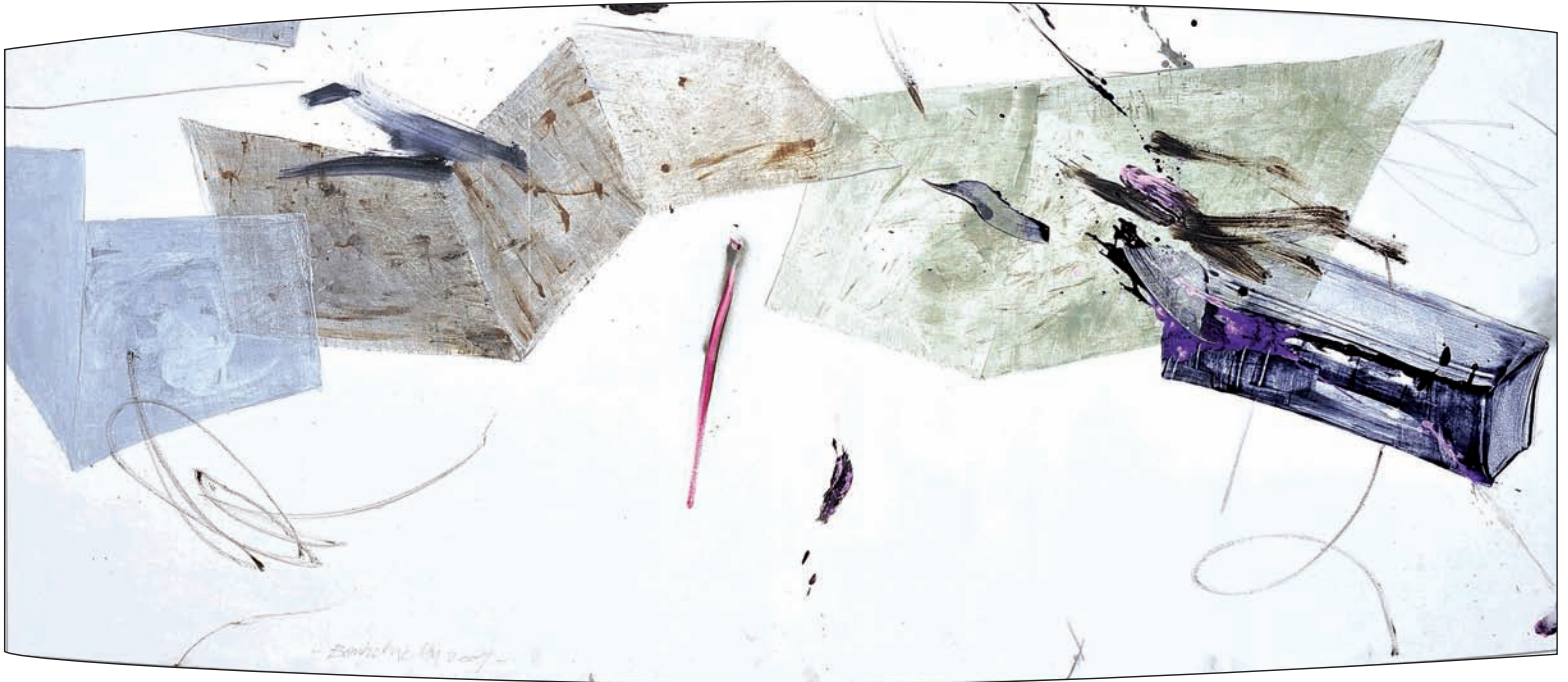
Sans titre Technique mixte sur toile 200 x 90 cm 2009