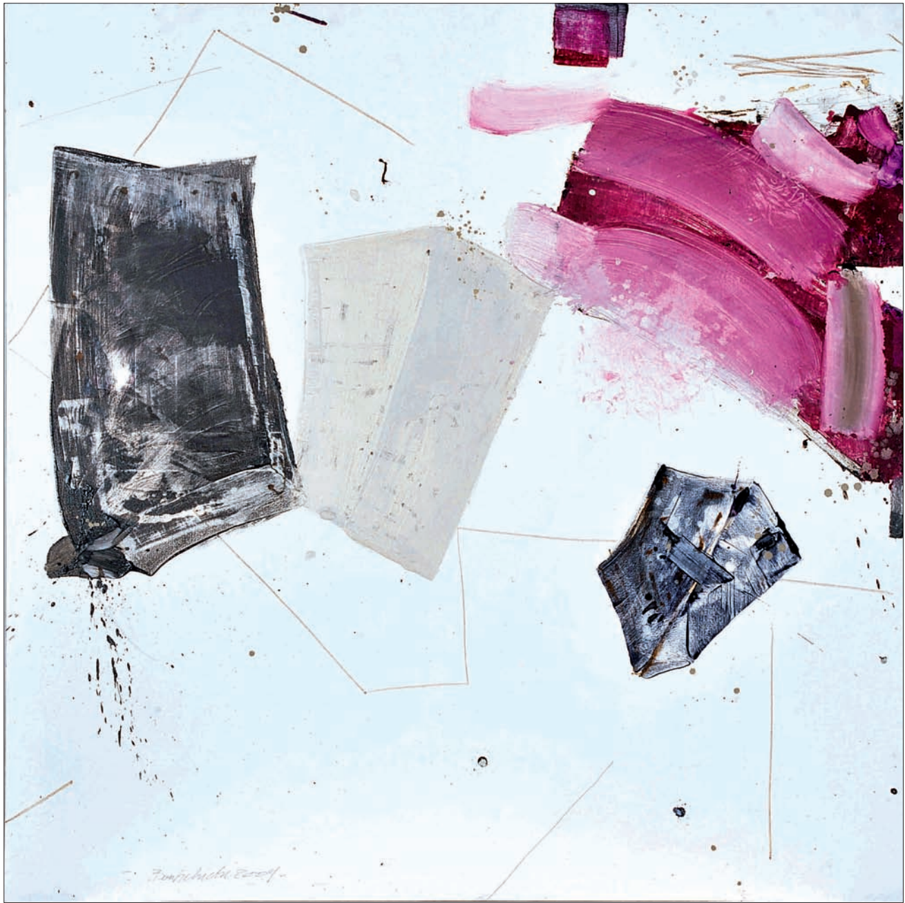
Sans titre Technique mixte sur toile 140 x 140 cm 2009