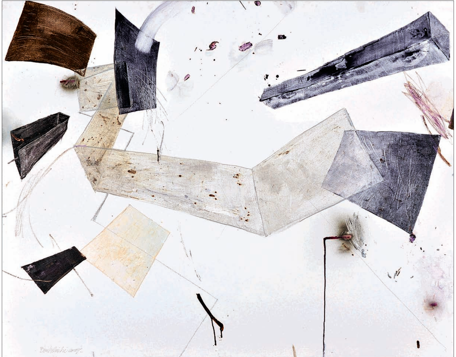
Sans titre Technique mixte sur toile 190 x 150 cm 2009