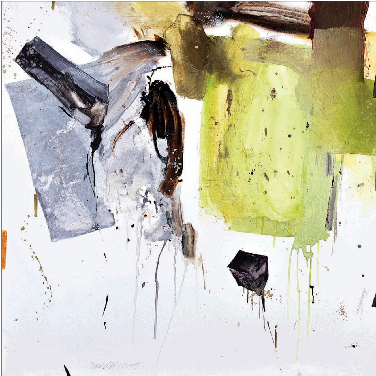
Sans titre Technique mixte sur toile 140 x 140 cm 2009