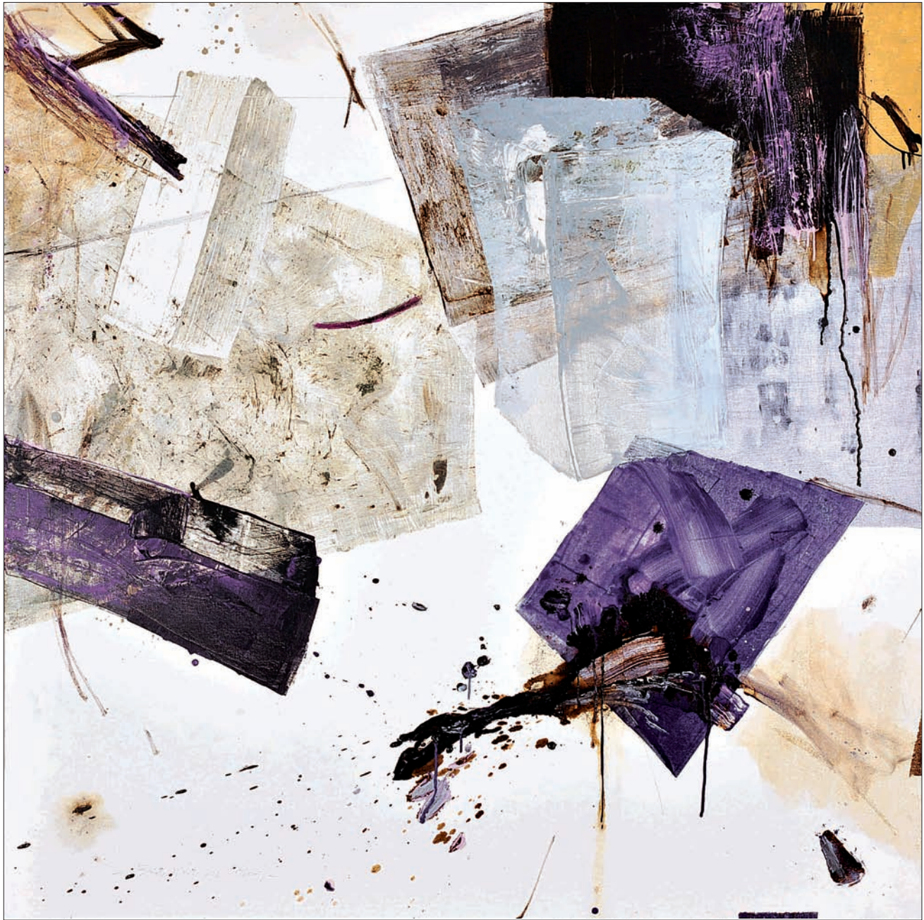
Sans titre Technique mixte sur toile 140 x 140 cm 2009