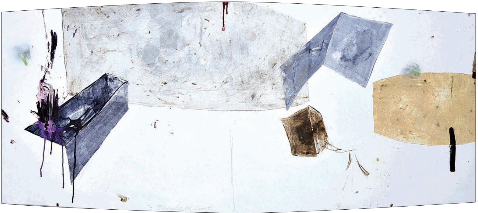
Sans titre Technique mixte sur toile 200 x 90 cm 2009