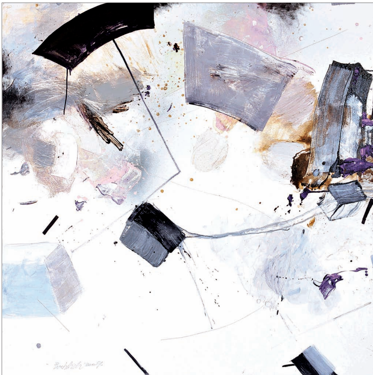
Sans titre Technique mixte sur toile 140 x 140 cm 2009