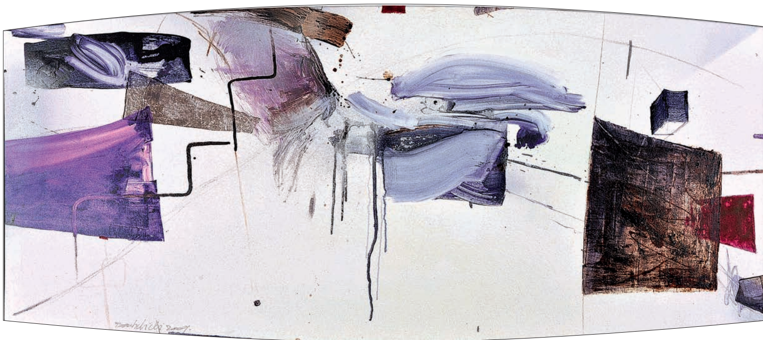
Sans titre Technique mixte sur toile 190 x 90 cm 2009