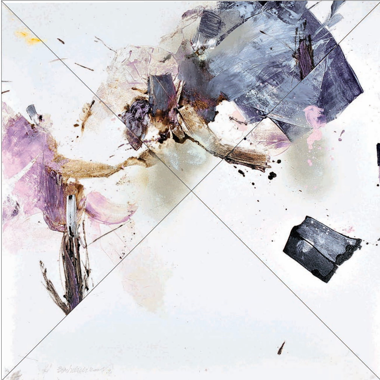
Sans titre Technique mixte sur toile 150 x 150 cm 2009