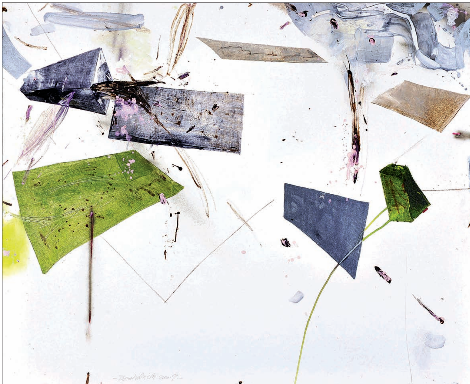
Sans titre Technique mixte sur toile 190 x 150 cm 2009