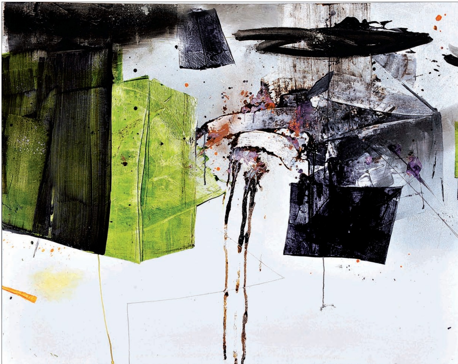
Sans titre Technique mixte sur toile 190 x 150 cm 2009