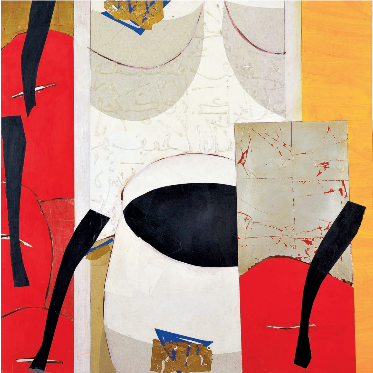
T de Rouge II Technique mixte sur bois, 100 x 100 cm 2007