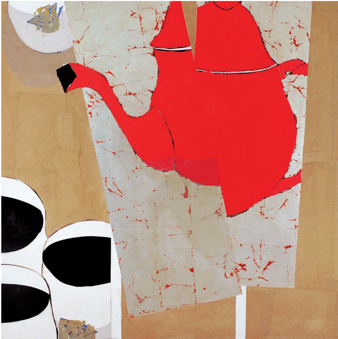
T du Thé III Technique mixte sur bois, 150 x 150 cm 2008