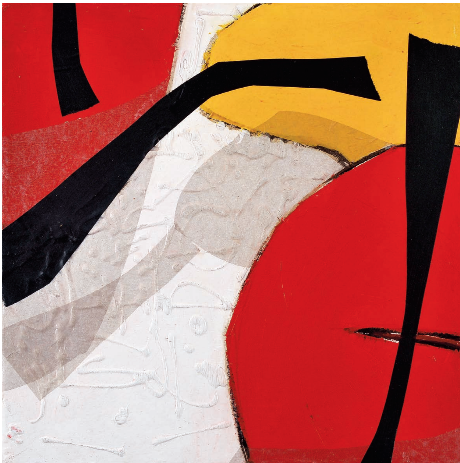
T Rouge III Technique mixte sur bois, 50 x 50 cm 2008