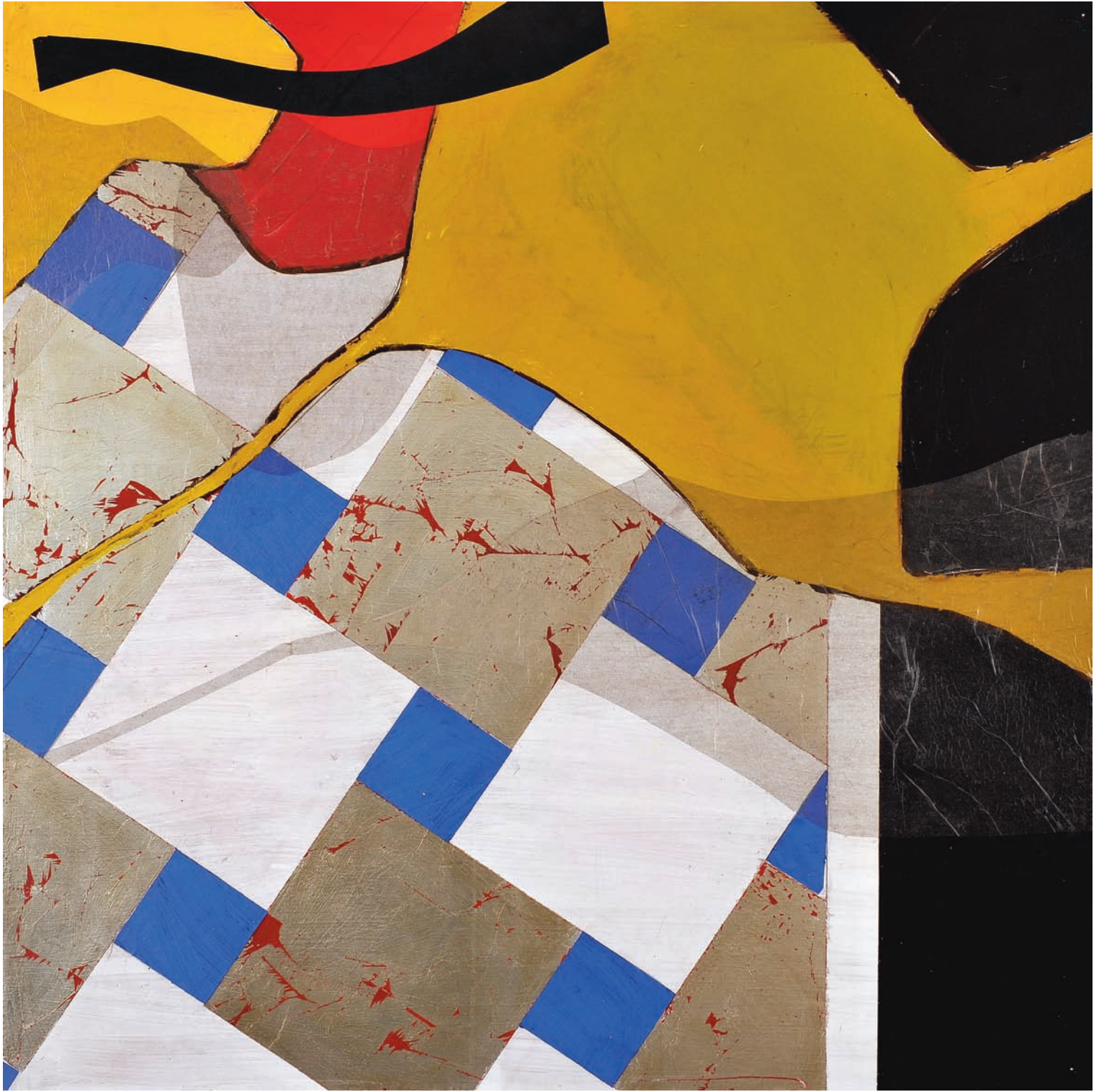
T de Terre VIII Technique mixte sur bois, 100 x 100 cm 2008