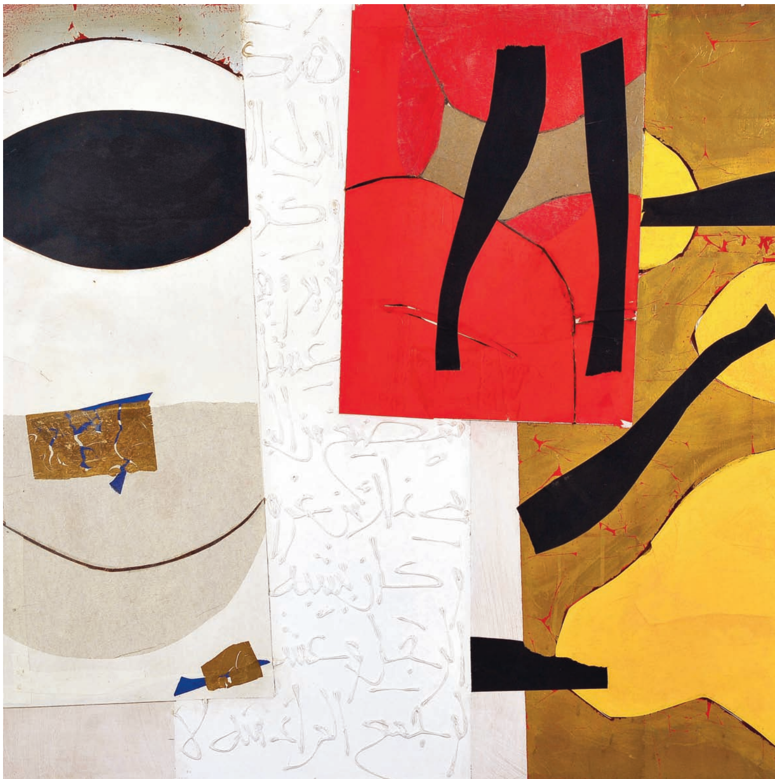
T Rouge I Technique mixte sur bois, 100 x 100 cm 2007