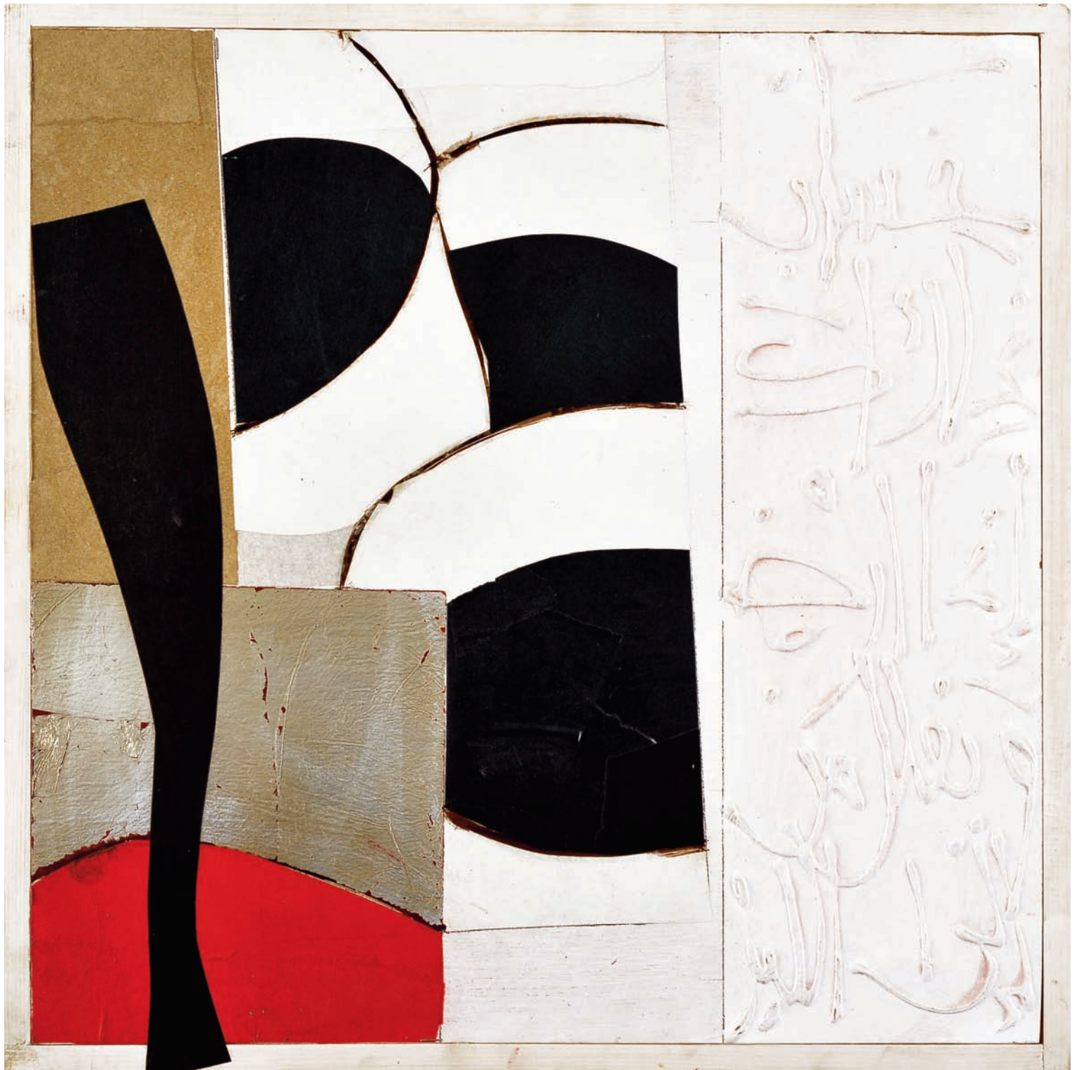
T de Tasse VI Technique mixte sur bois, 50 x 50 cm 2007