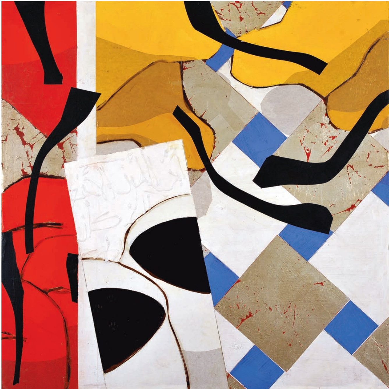
T de Terre VII Technique mixte sur bois, 100 x 100 cm 2008