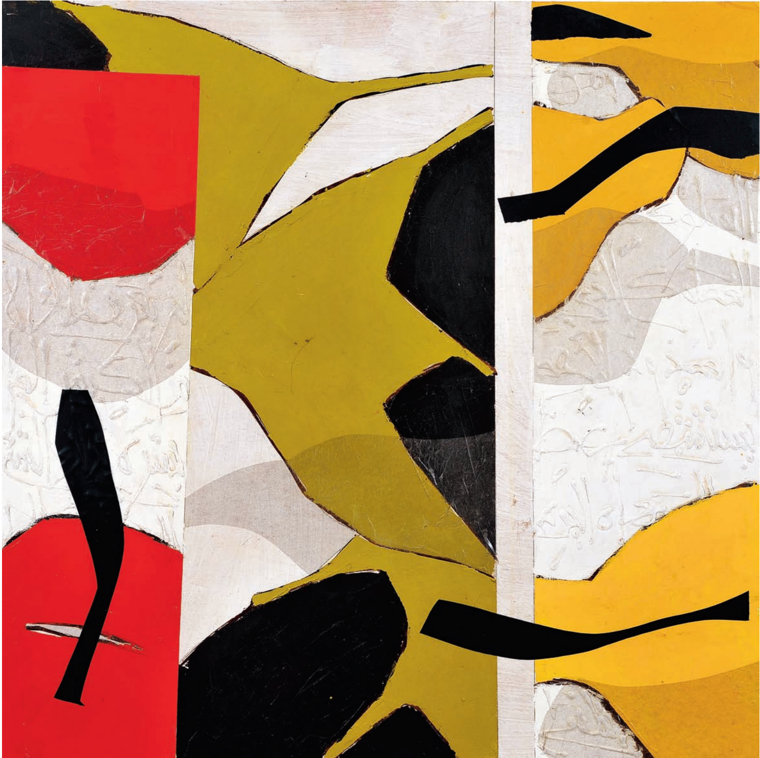
T de Terre V Technique mixte sur bois, 100 x 100 cm 2008