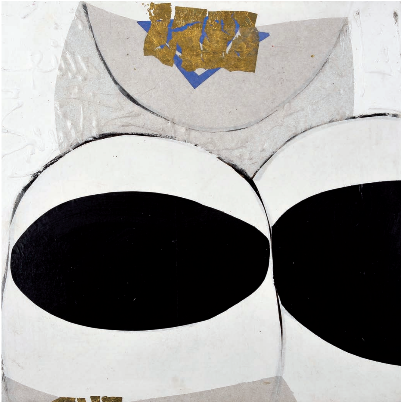
T de Tasse Technique mixte sur bois, 50 x 50 cm 2008