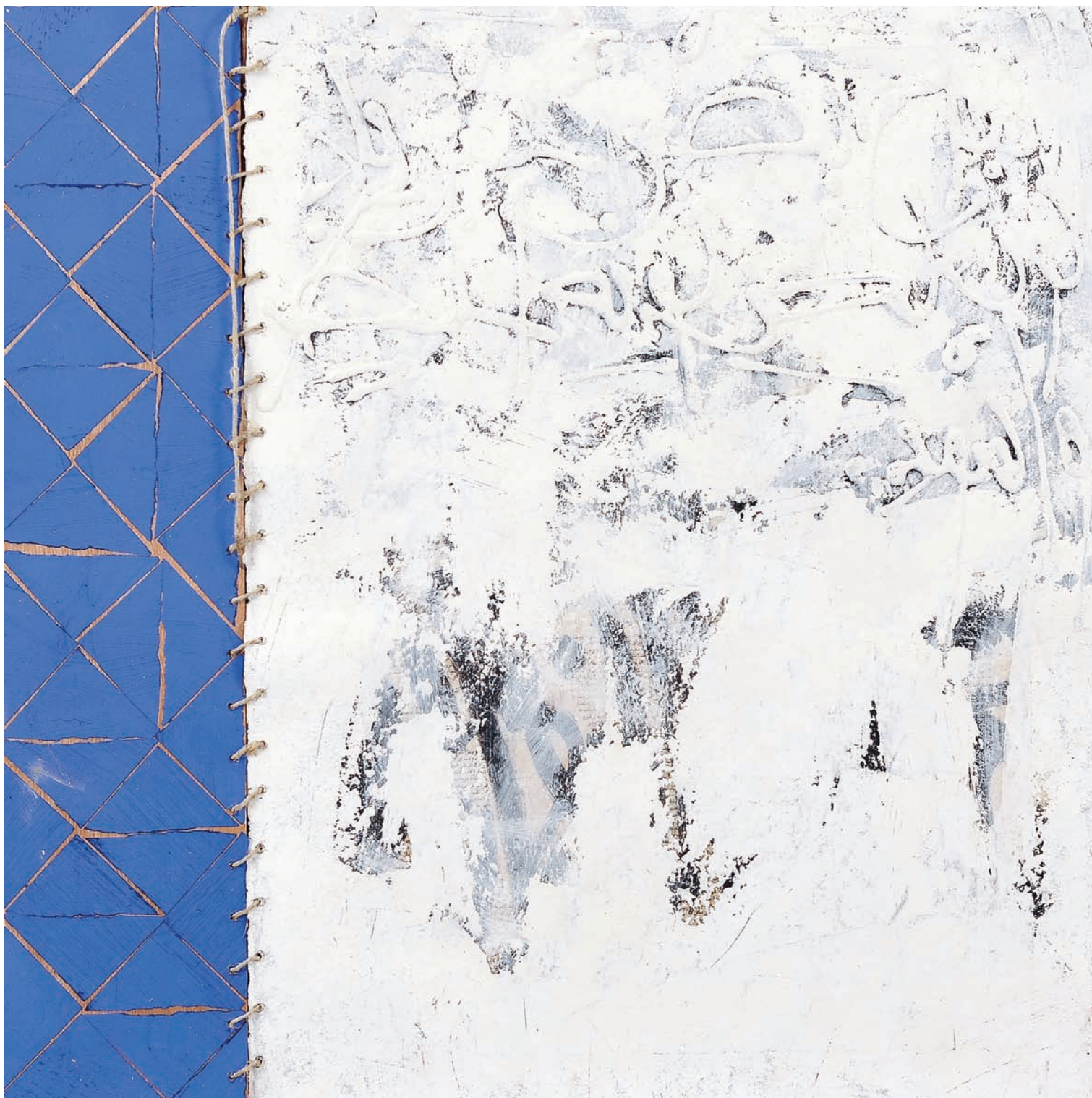
T de Teinte V Technique mixte sur papier, 65 x 70 cm 2008