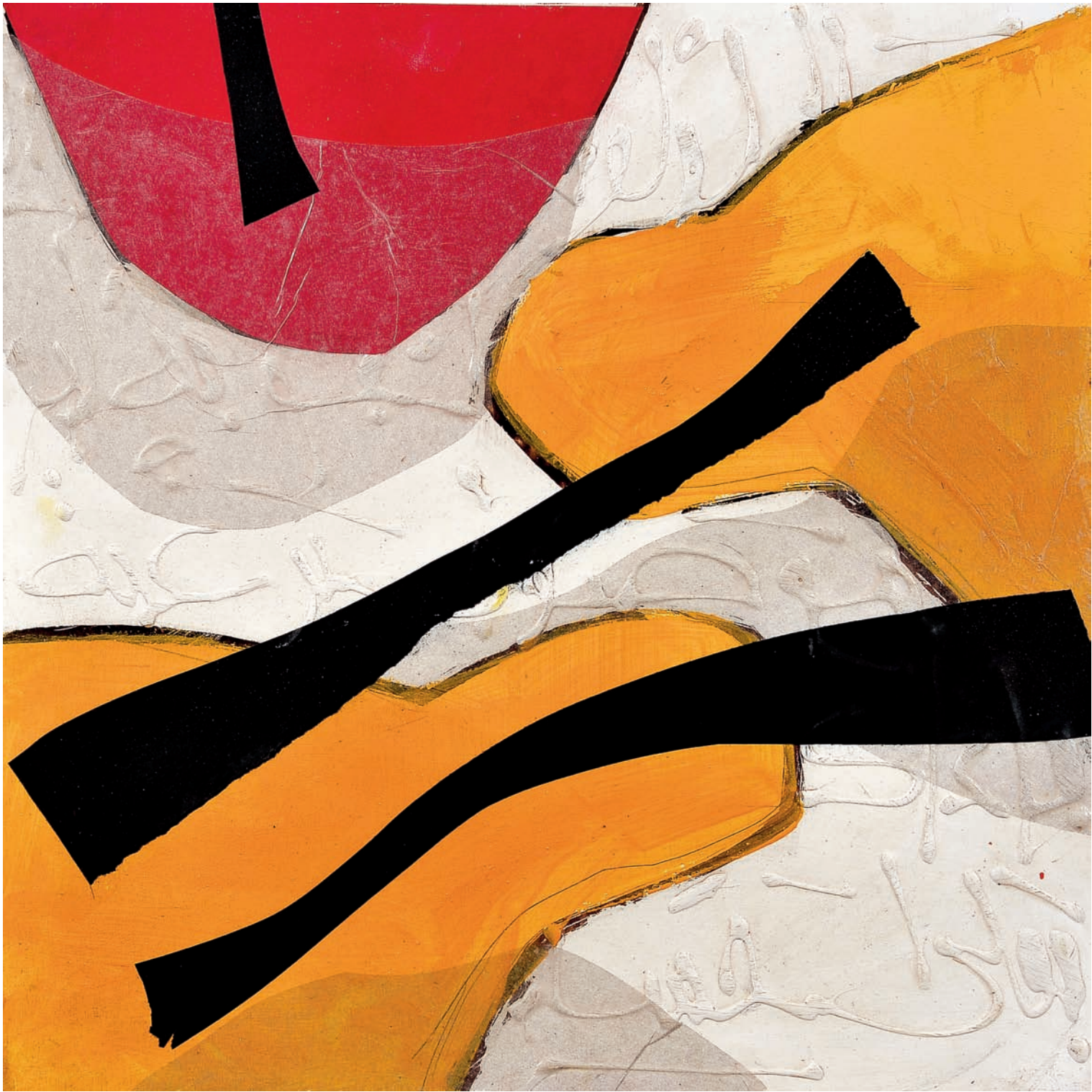
T de Terre III Technique mixte sur bois, 50 x 50 cm 2008