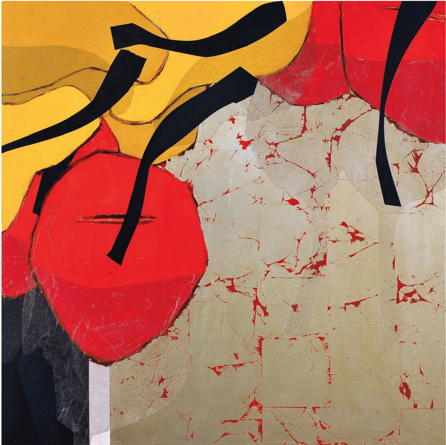
T de Terre IV Technique mixte sur bois, 100 x 100 cm 2008