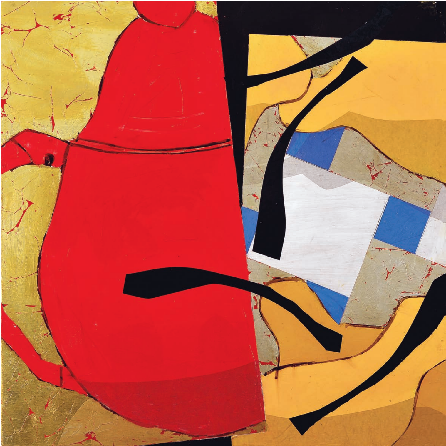
T de Thé V Technique mixte sur bois, 100 x 100 cm 2008