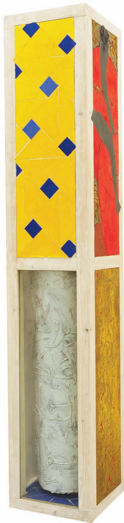
V. Fenêtres II Technique mixte sur bois, 180 x 31 x 31 cm 2007