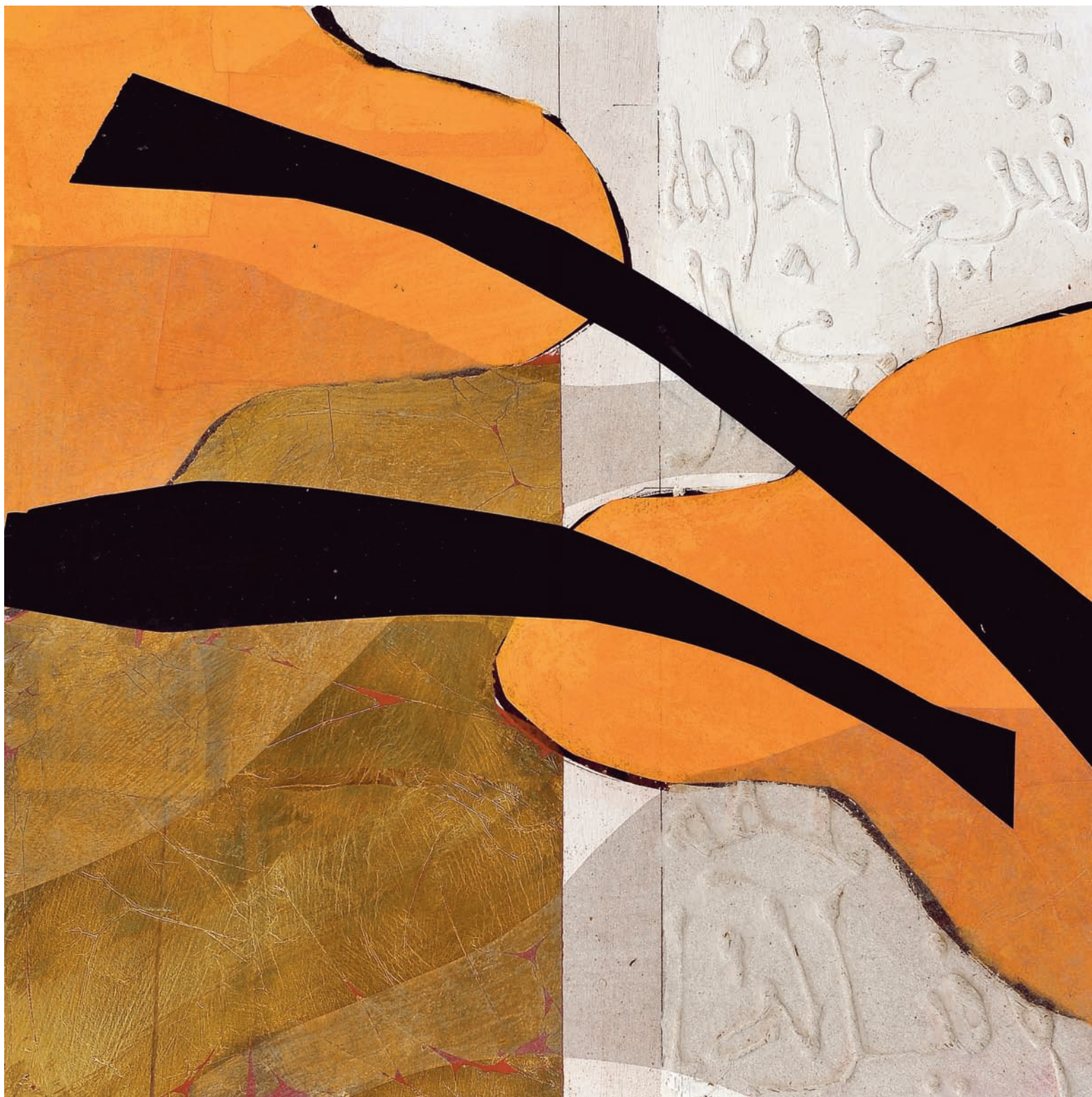
T de Terre IV Technique mixte sur bois, 50 x 50 cm 2008