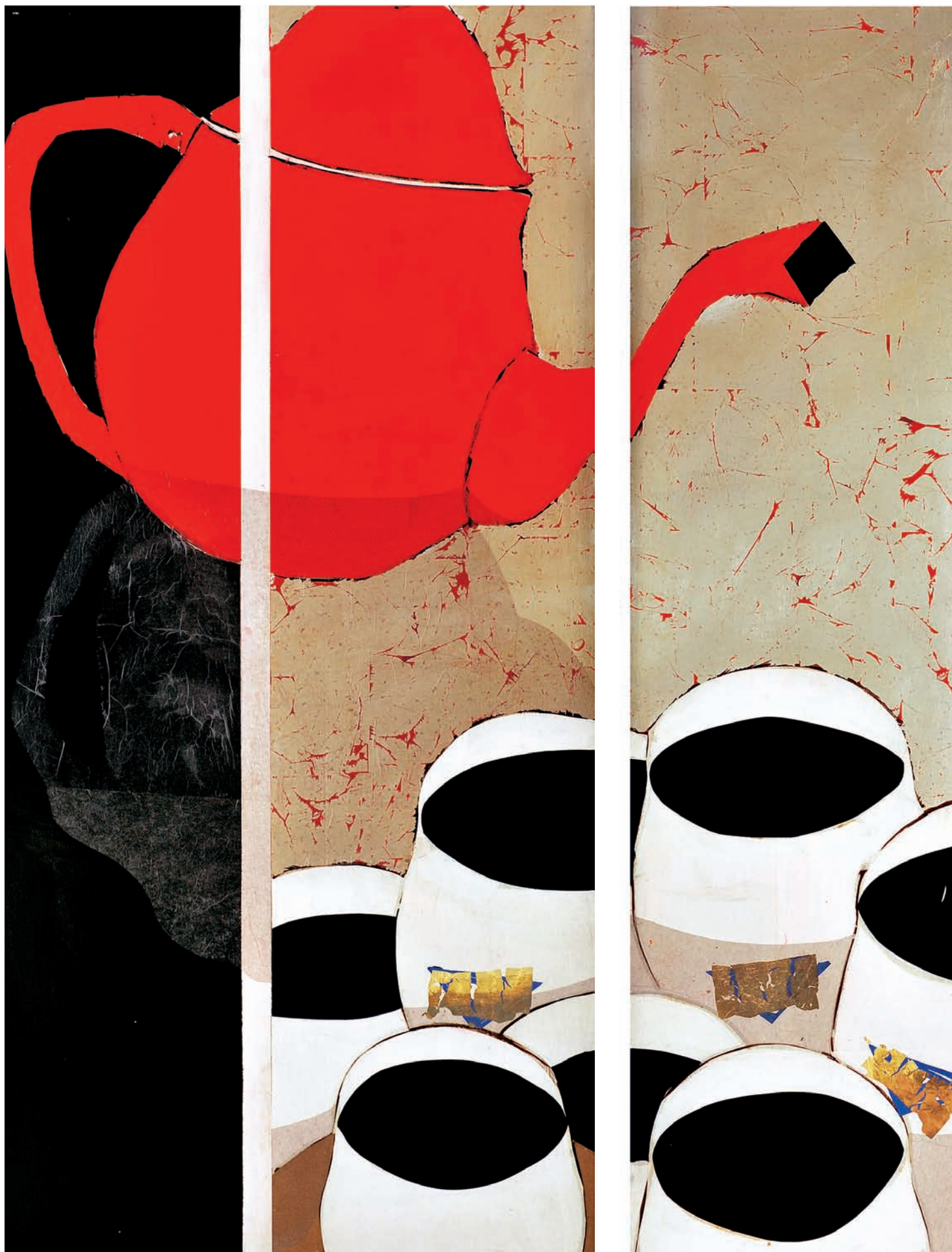
T du Thé Technique mixte sur bois 200 x 364 cm 2008