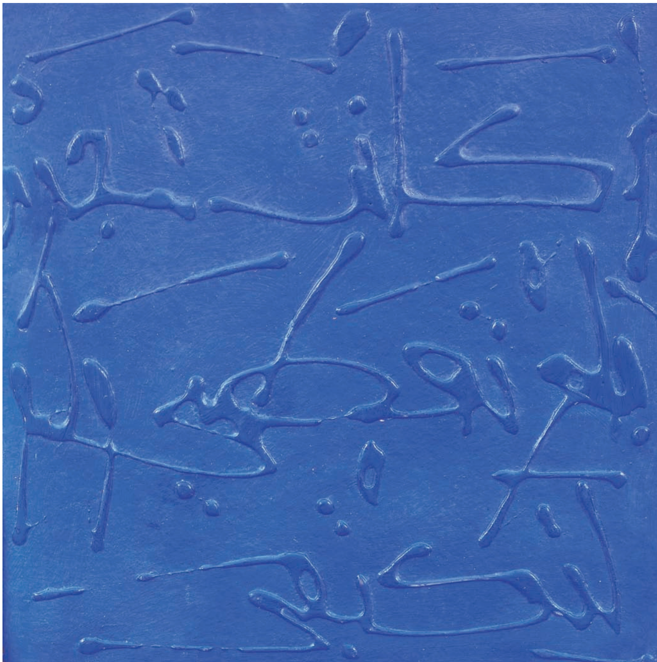
T de Teinte Technique mixte sur papier, 30 x 30 cm 2008