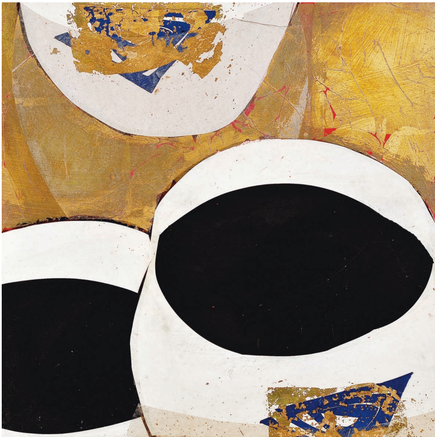
T de Tasse III, Technique mixte sur bois, 50 x 50 cm 2008