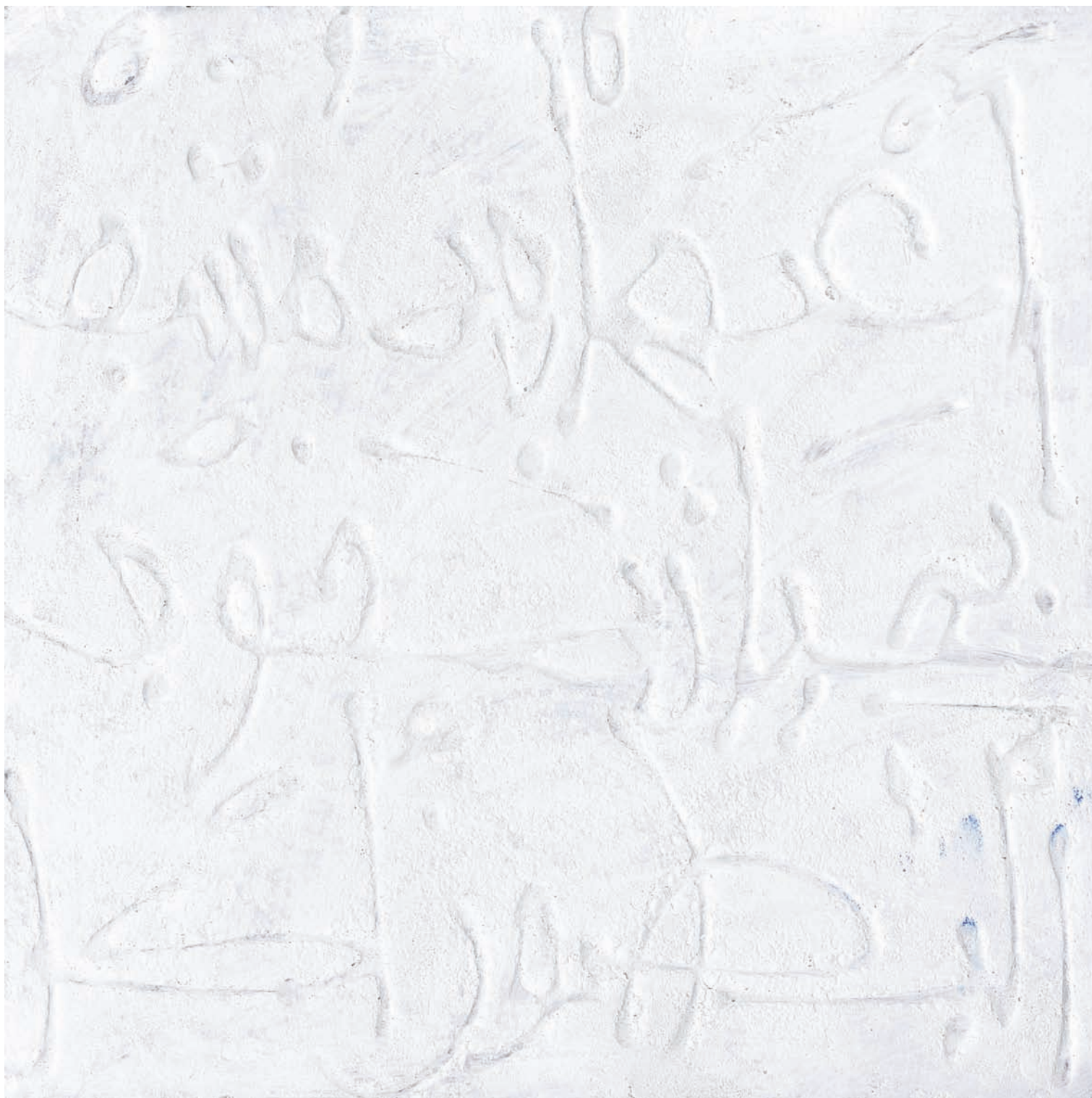
T de Teinte IV Technique mixte sur papier, 30 x 30 cm 2008