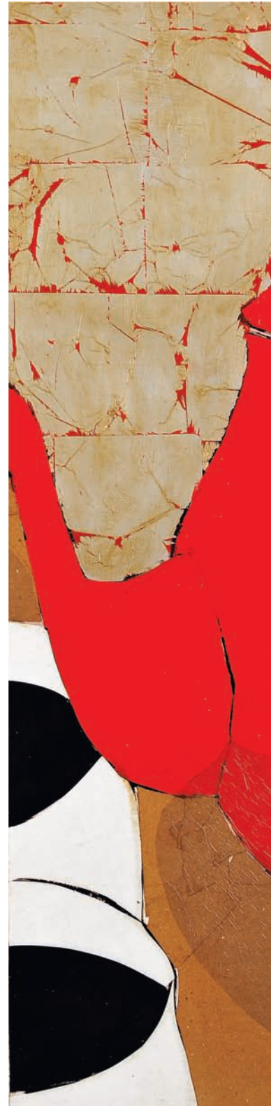
T de Tasse II Technique mixte sur bois, 122 x 94 cm 2008