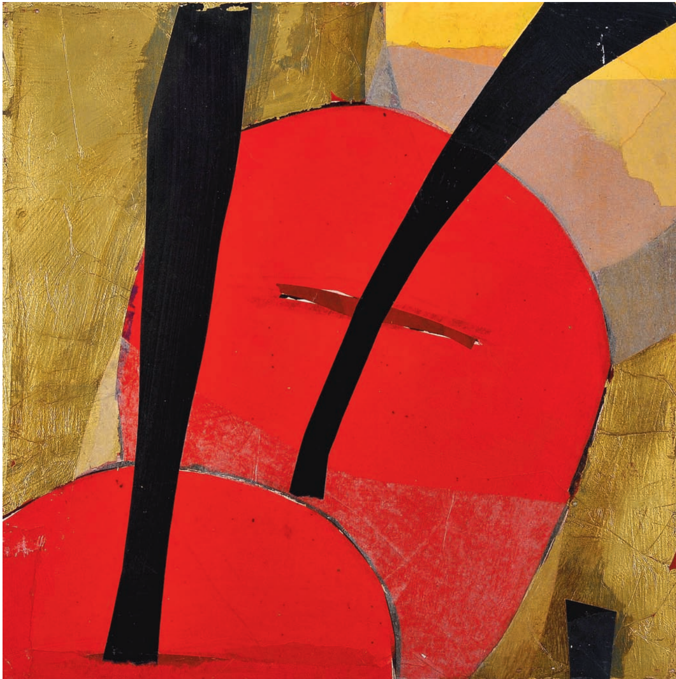
T de Terre II Technique mixte sur bois, 50 x 50 cm 2008