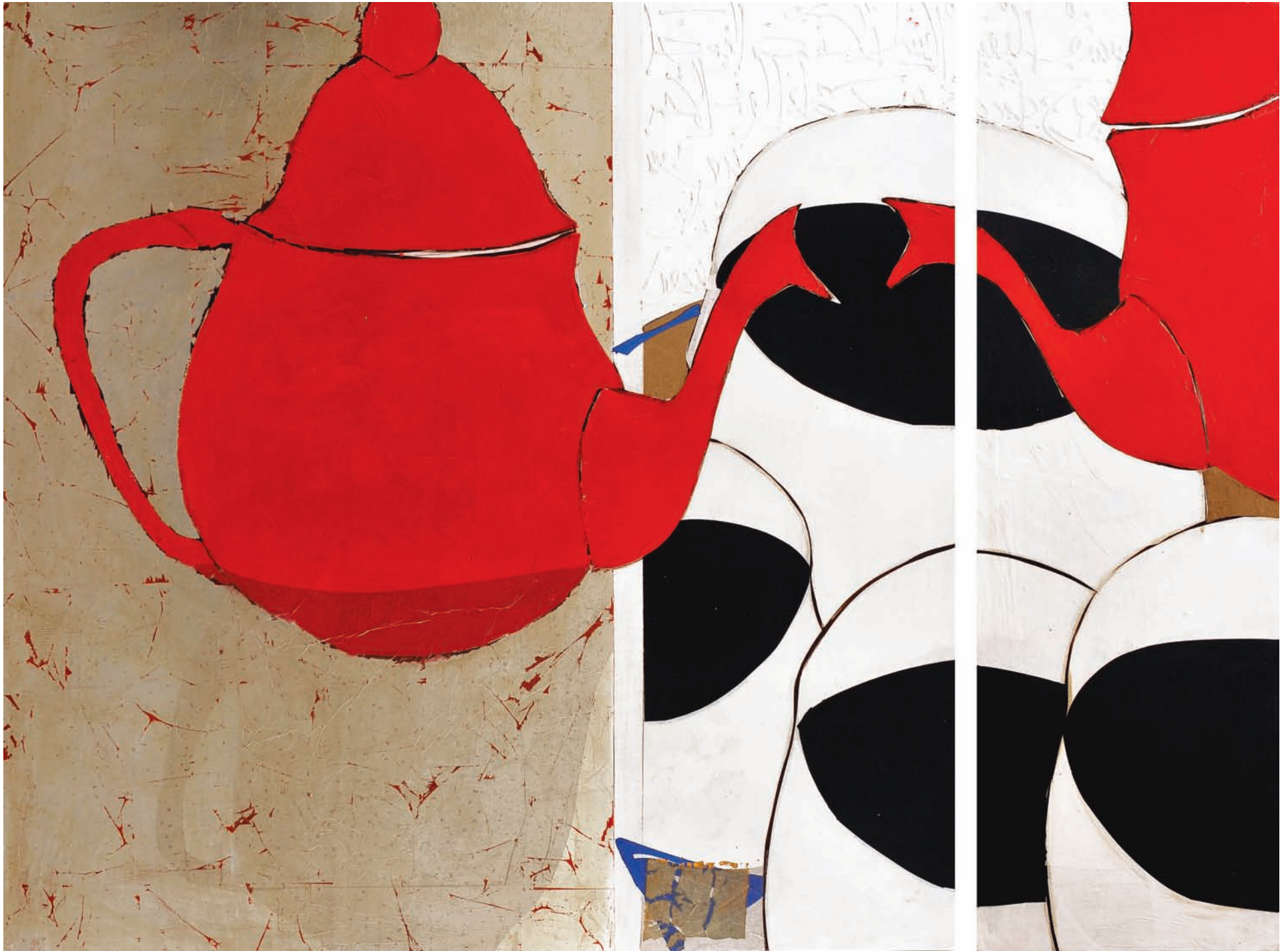
T du Thé et de Tasse Technique mixte sur bois, 150 x 204 cm 2008