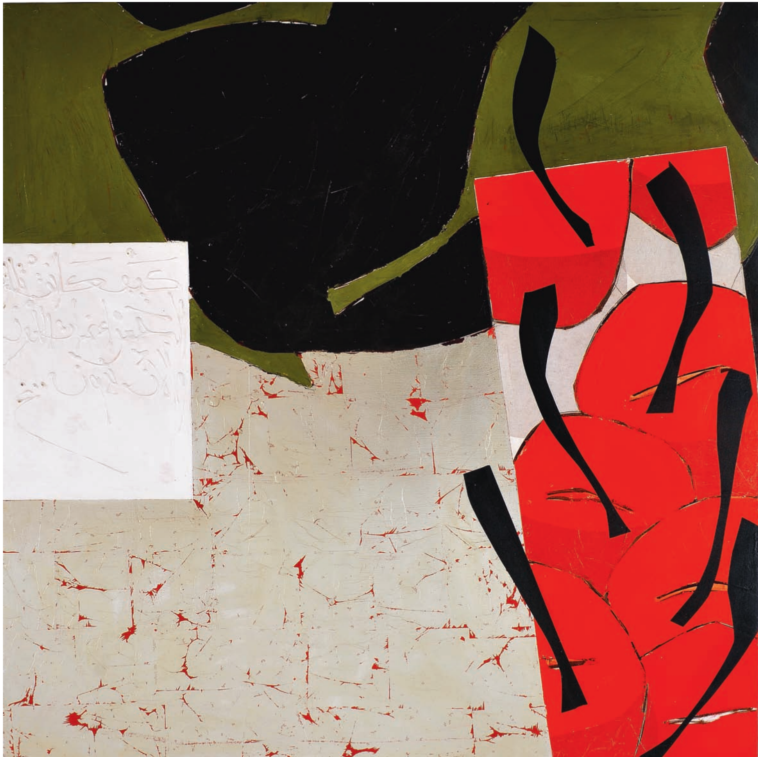
T de Terre VI Technique mixte sur bois, 150 x 150 cm 2008