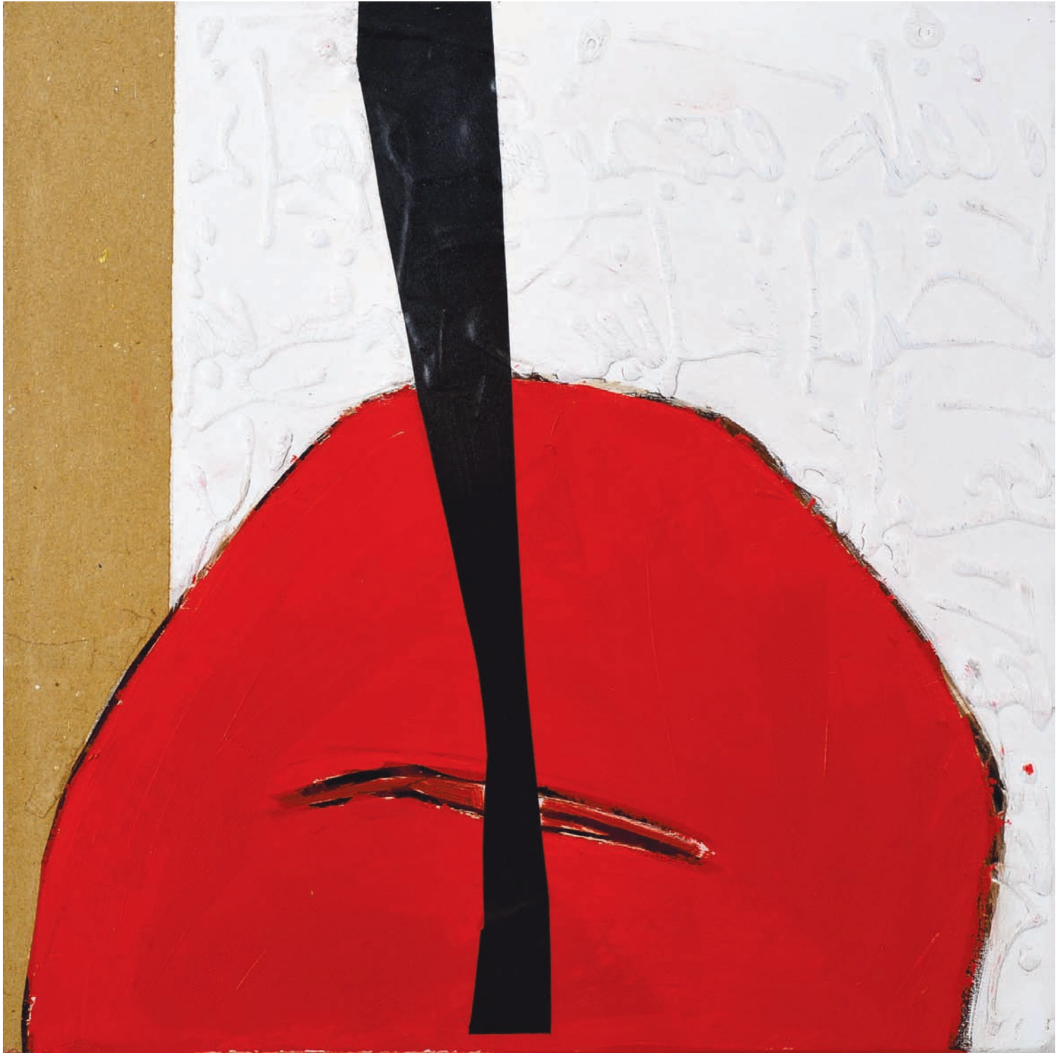
T de Terre Technique mixte sur bois, 50 x 50 cm 2008