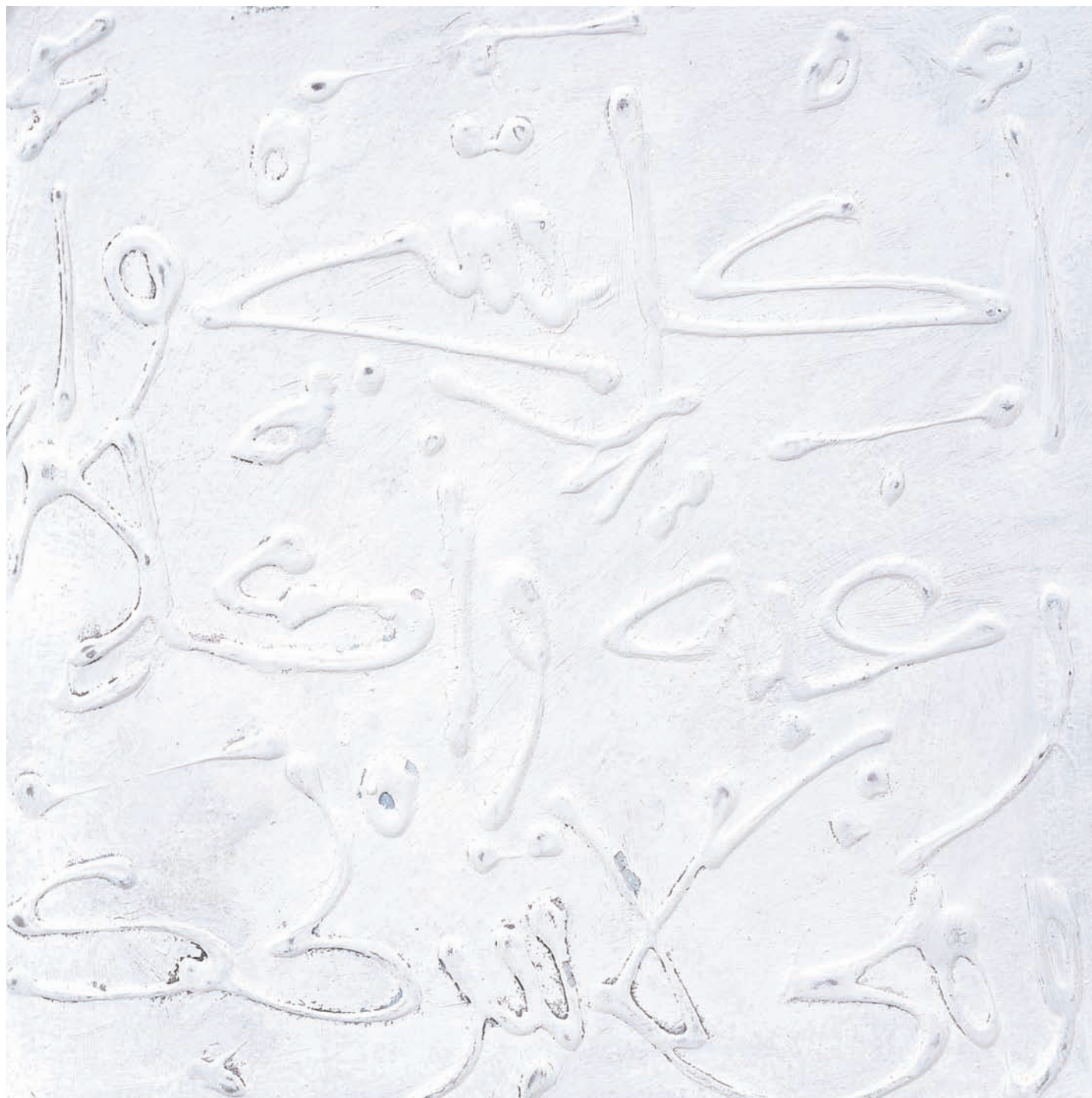
T de Teinte VII Technique mixte sur papier, 30 x 30 cm 2008