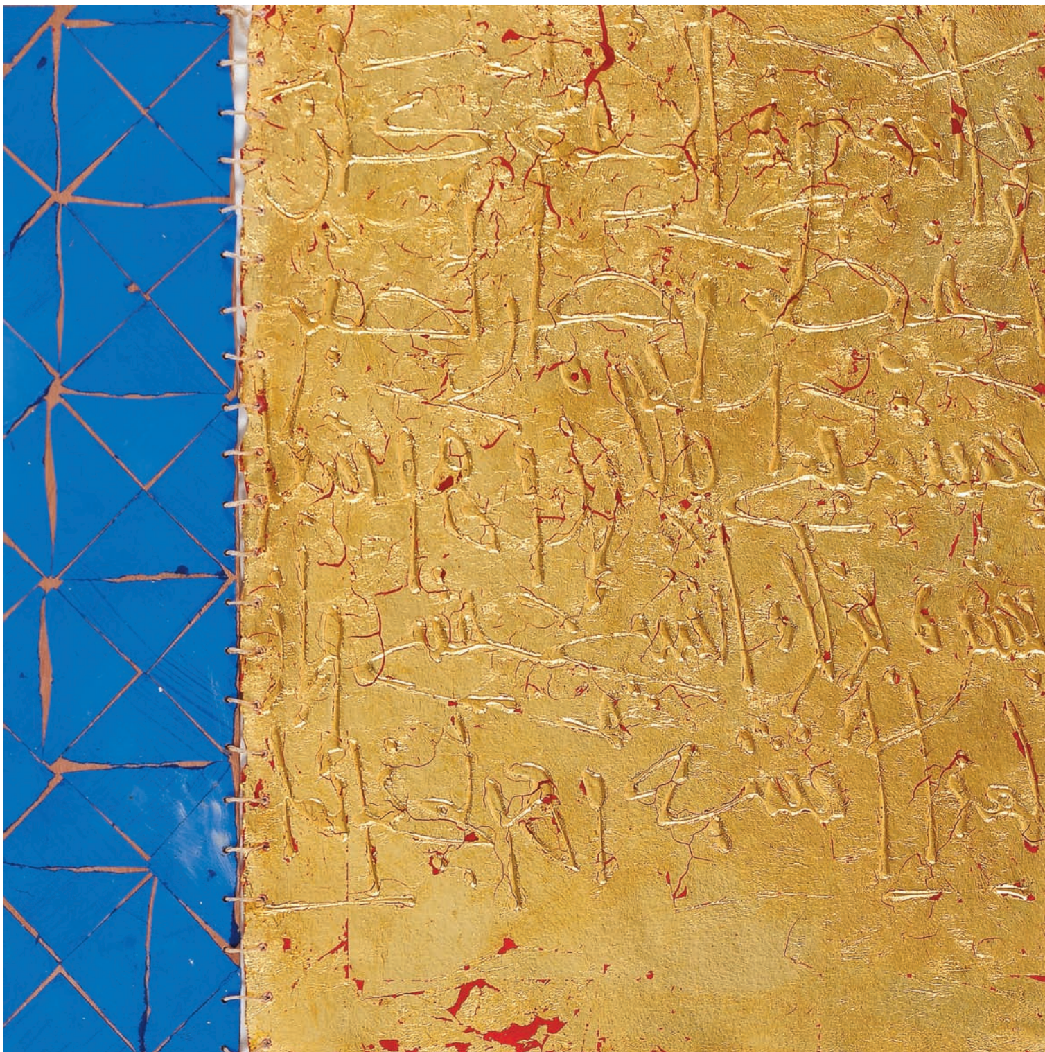
T de Teinte VIII, Technique mixte sur papier, 65 x 70 cm 2008