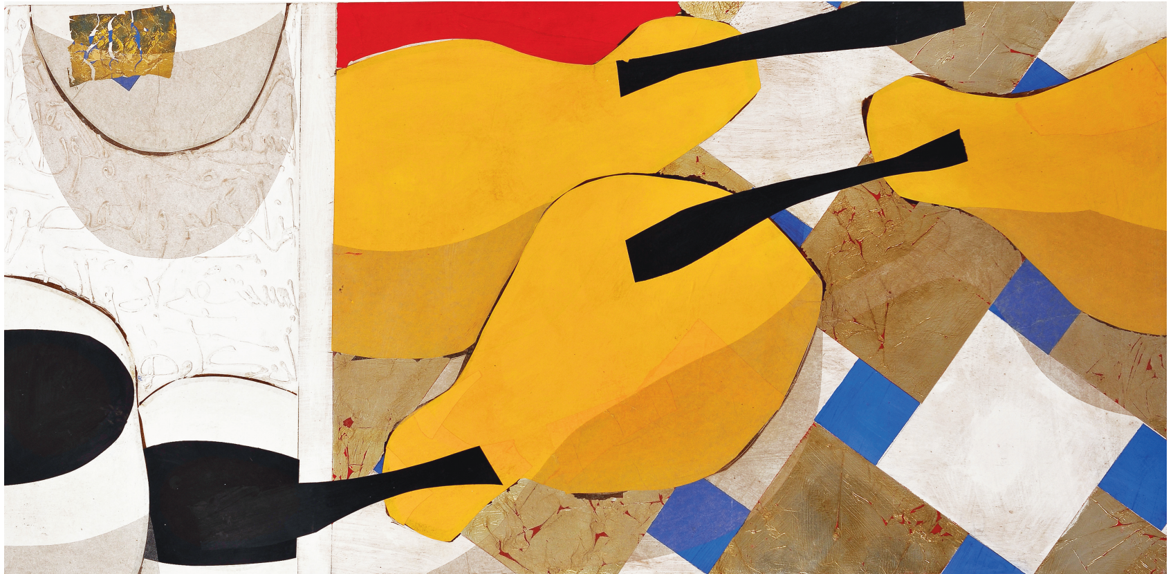
T de Terre VI Technique mixte sur papier, 80 x 150 cm 2007