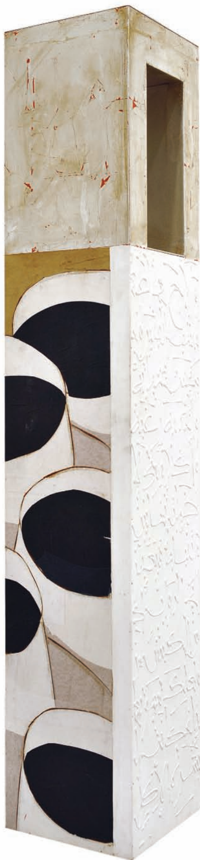
V. Fenêtres III Technique mixte sur bois, 180 x 31 x 31 cm 2008