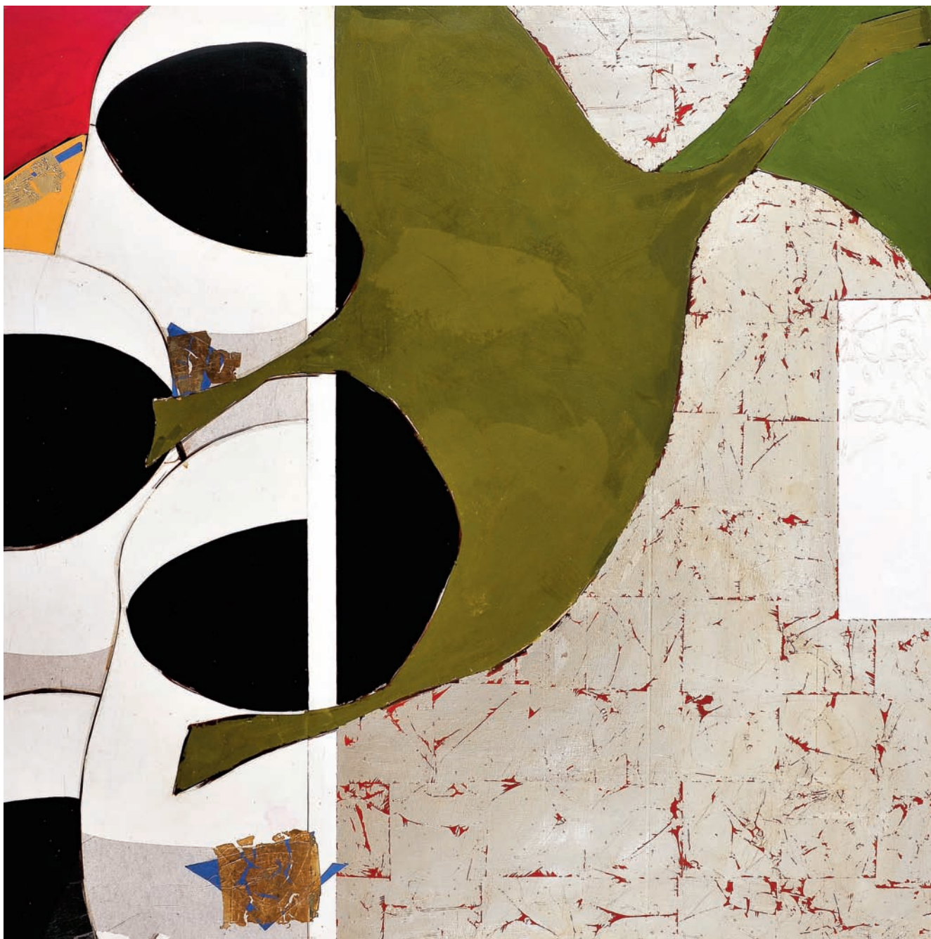
T de Tasse VI Technique mixte sur bois, 150 x 150 cm 2008