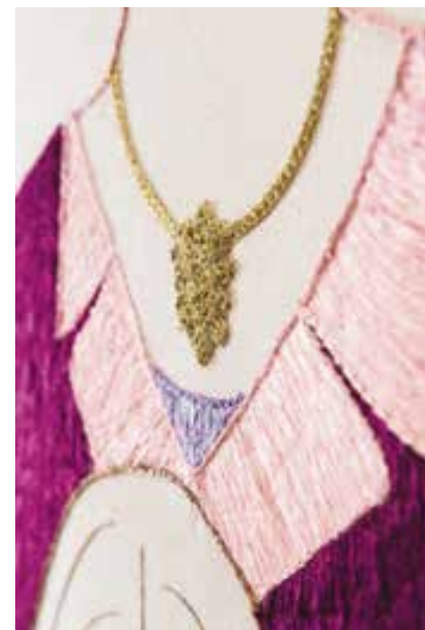
Les Invisibles 2, détails