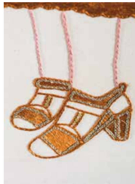
Les Invisibles 4, détails

Les Invisibles 4 Broderie coton et soie de sabra à la main sur toile Hand-embroidered cotton and silk sabra on canvas 108 x 80 cm 2024