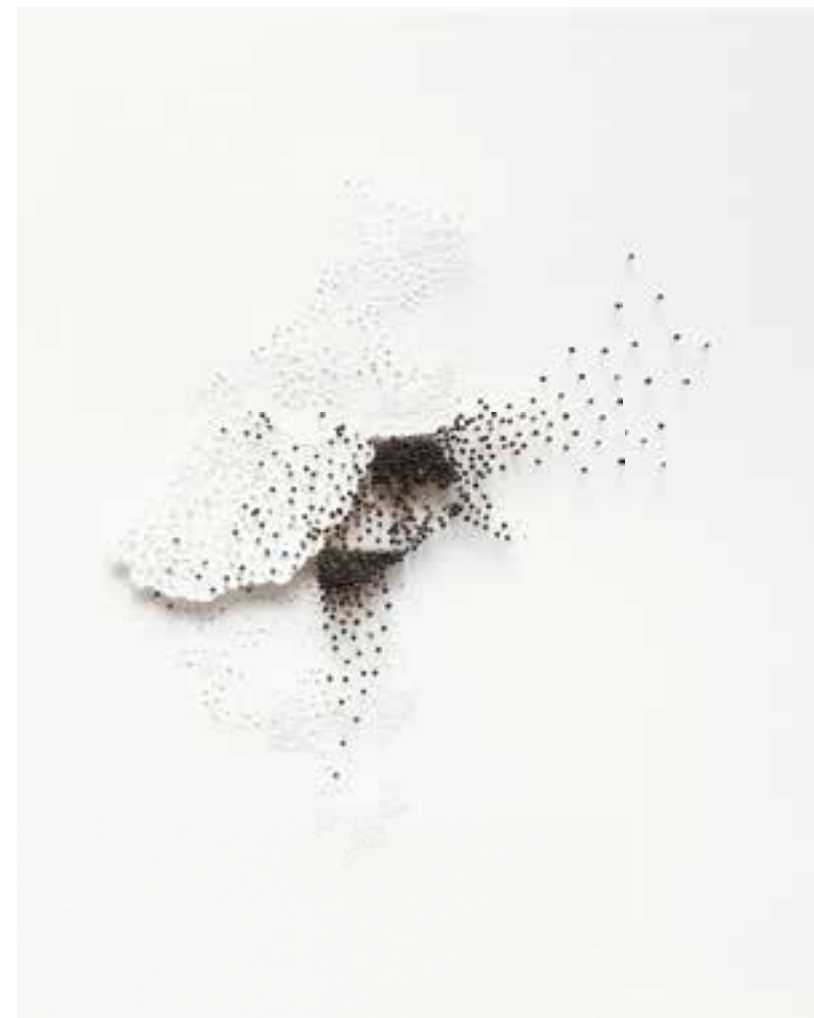
Se déplacer II & III Épingles et papier troué sur papier coton Needles and cut paper on cotton paper 30 x 24 cm (each) 2024