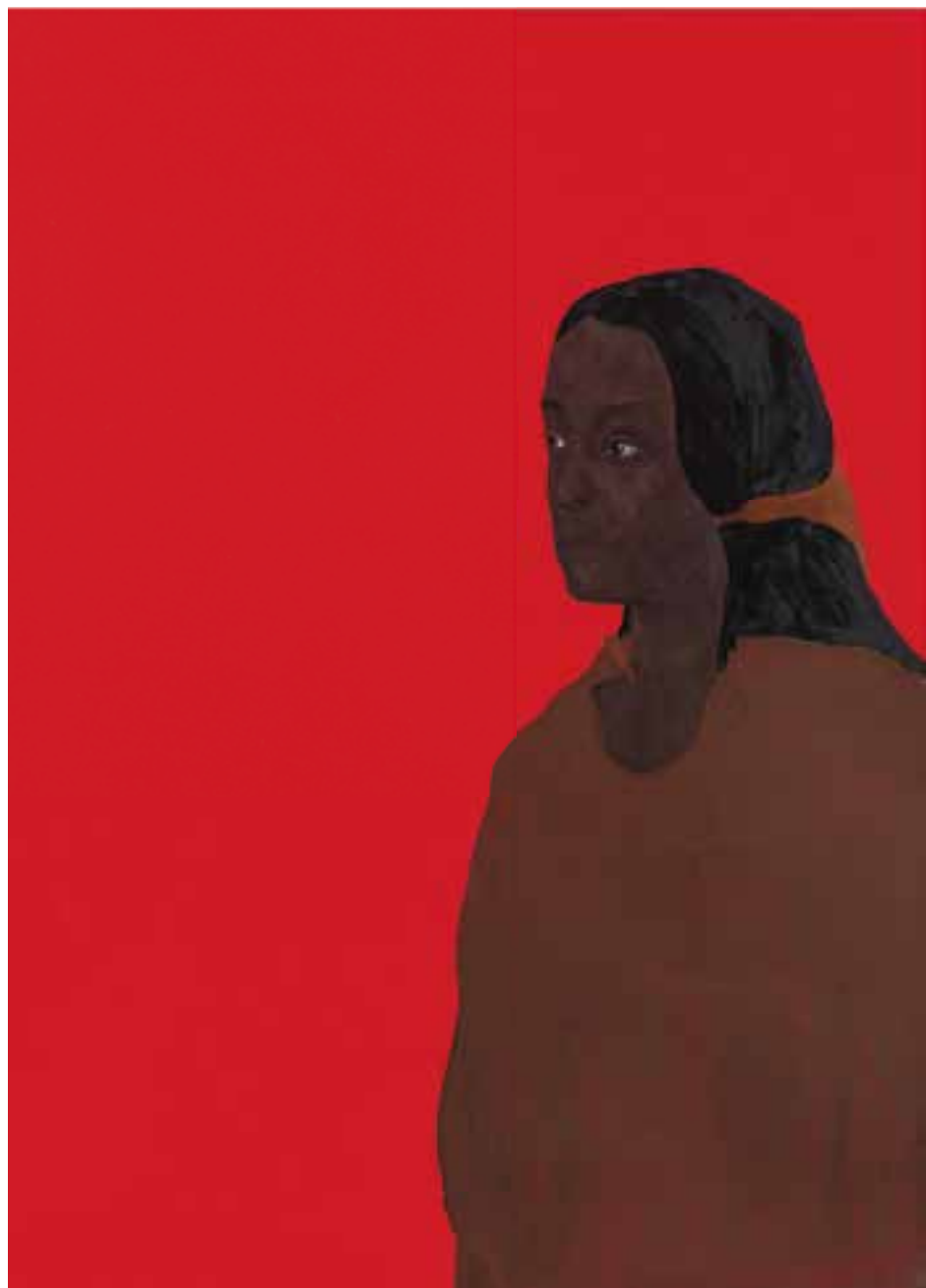
Dans l'attente #1 & #2 Technique mixte sur caoutchouc / Mixed media on rubber 150 x 110 cm (each) 2024