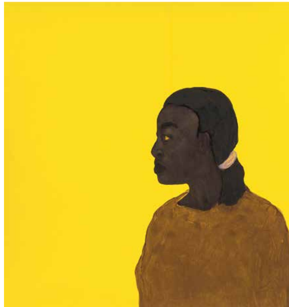
B'lal & La sénégalaise

Technique mixte sur caoutchouc / Mixed media on rubber