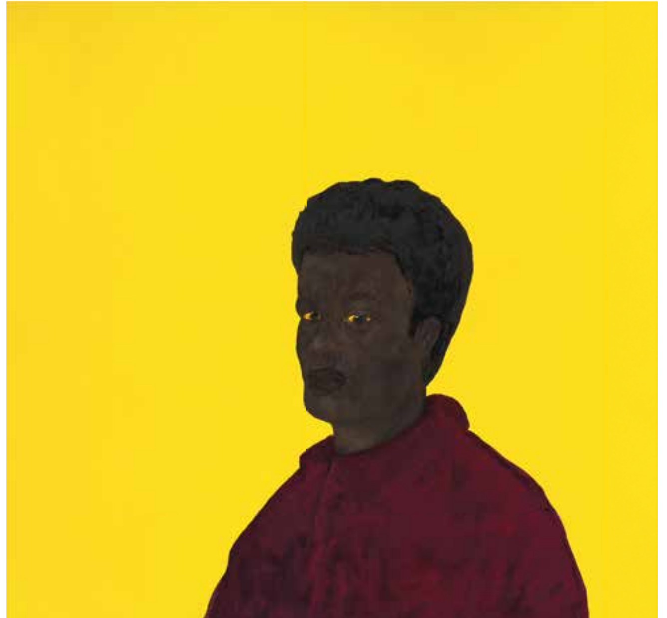
Sans titre Technique mixte sur caoutchouc / Mixed media on rubber 95 x 100 cm 2024