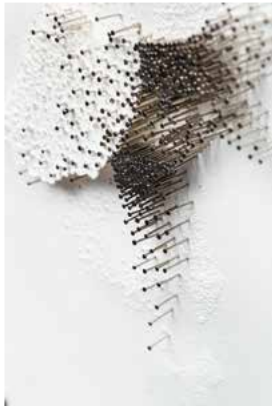
Se déplacer II & III, détails