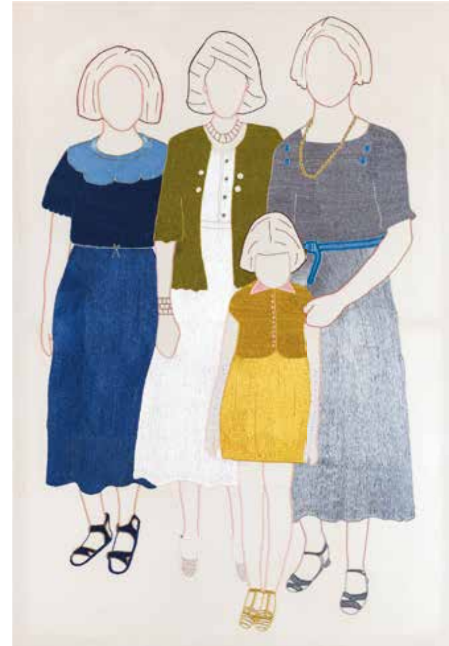
Les Invisibles 1

Margaux lives and works between Paris and Massa, Morocco.