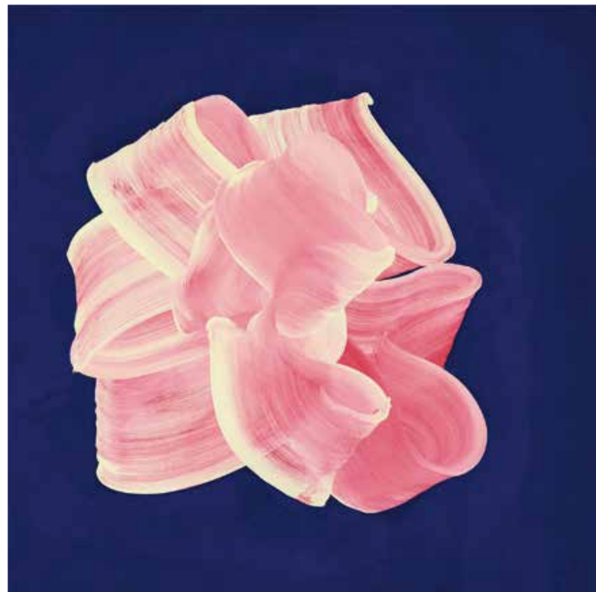
Rosebud Acrylique et pigments sur toile / Acrylic and pigments on canvas 90 x 90 cm 2024