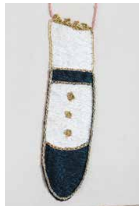
Les Invisibles 3, détails