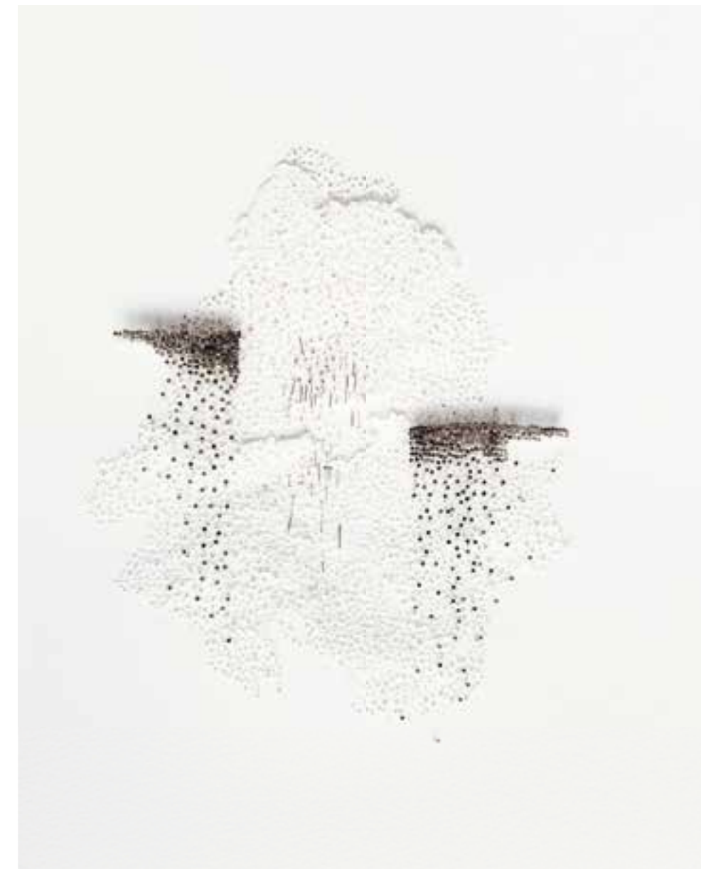
Se déplacer I Épingles et papier troué sur papier coton Needles and cut paper on cotton paper 30 x 24 cm 2024