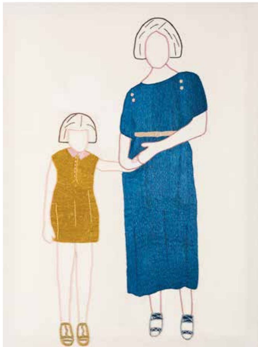
Les Invisibles 5 & 6

Broderie coton et soie de sabra à la main sur toile