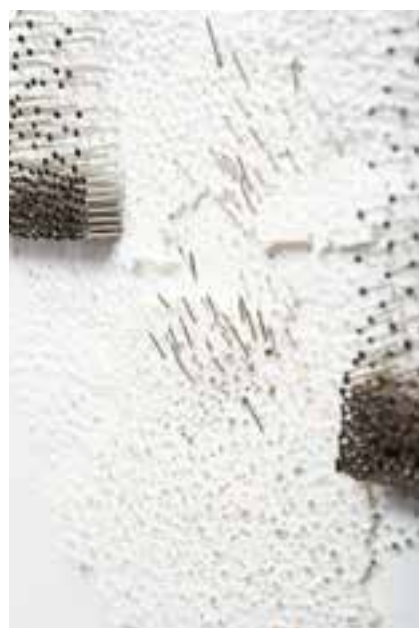
Se déplacer I, détails