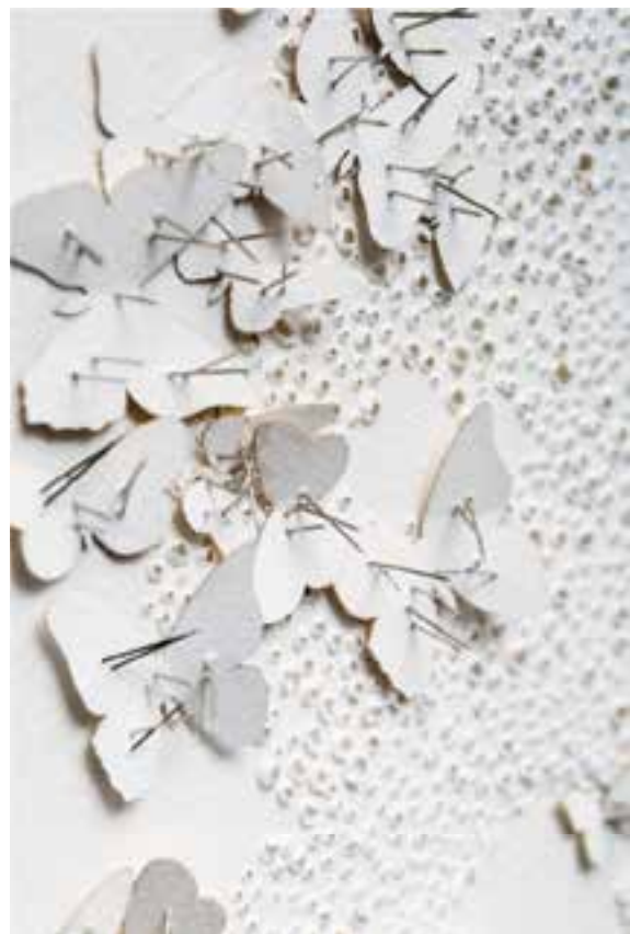
Les ailes épinglées I, détails